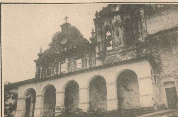
Um belo monumento precisando urgentemente ser melhor preservado