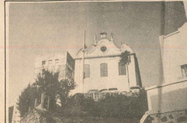
Outro monumento histórico