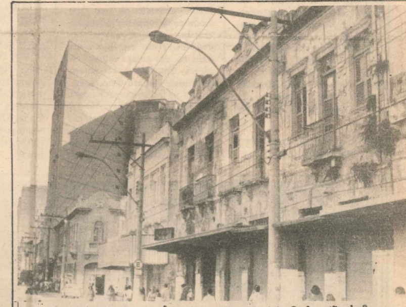
Aqui, em Vitória, haviam muitos prédios coloniais. Onde estão eles?