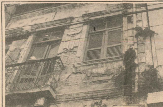
Esse casarão já perdeu seu esplendor. Hoje o tempo e a falta de cuidado o destroem