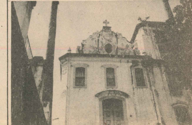
Uma velha Igreja, ainda livre da ameaça do tempo