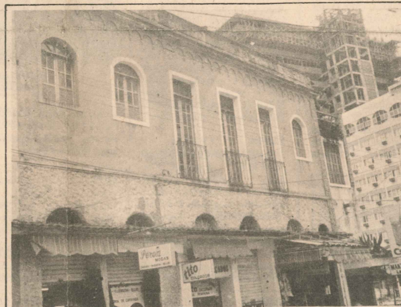
Preservado em cima e descaracterizado em baixo

Conjunto dos Reis Magos , em Nova Almeida. Construído no século XVI (1580). Tombado pelo IPHAN, não tem nenhuma utilização atual. Em bom estado de conservação, após a restauração realizada pelo IPHAN. Recomenda-se a agilização na criação do museu proposto para o local complementação da restauração da Igreja (retábulo da nave).