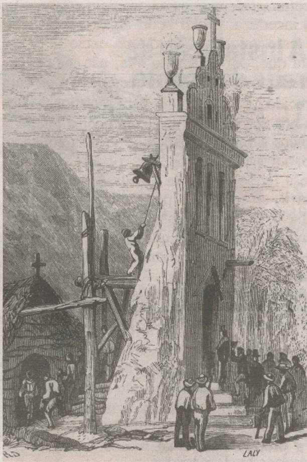
DESENHOS mostram como era a fachada da Igreja de Nossa Senhora da Penha no século XIX

da em 1836, sendo um marco histórico da arquitetura no período da colonização.