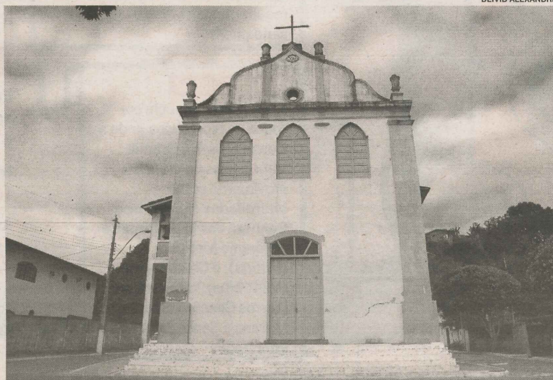
A IGREJA é um dos principais patrimônios históricos de Aracruz