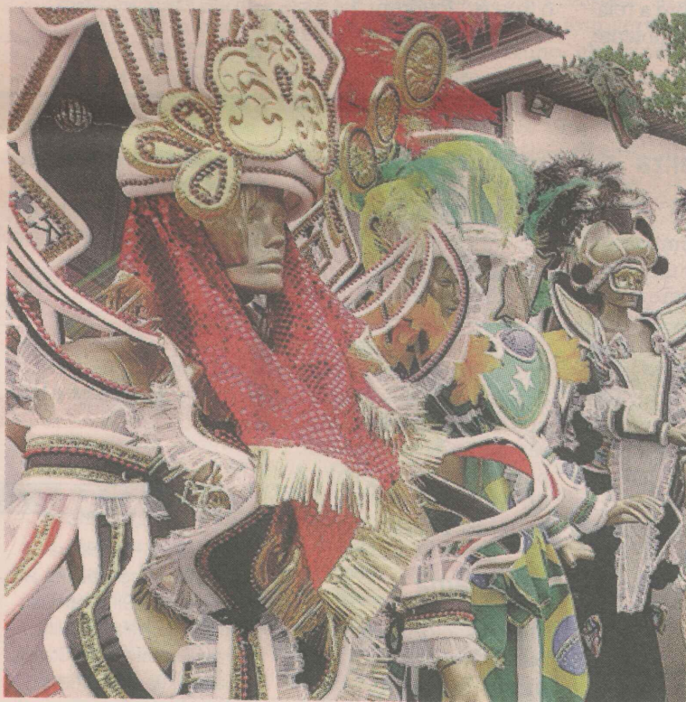
FANTASIAS. Os preços variam de R$ 25 a R$ 160.