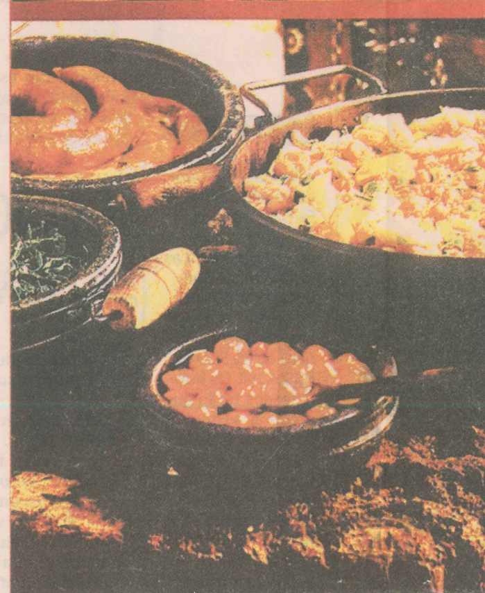
CARDÁPIO. Frutos do mar e culinária mineira: cardápio forte em Manguinhos.