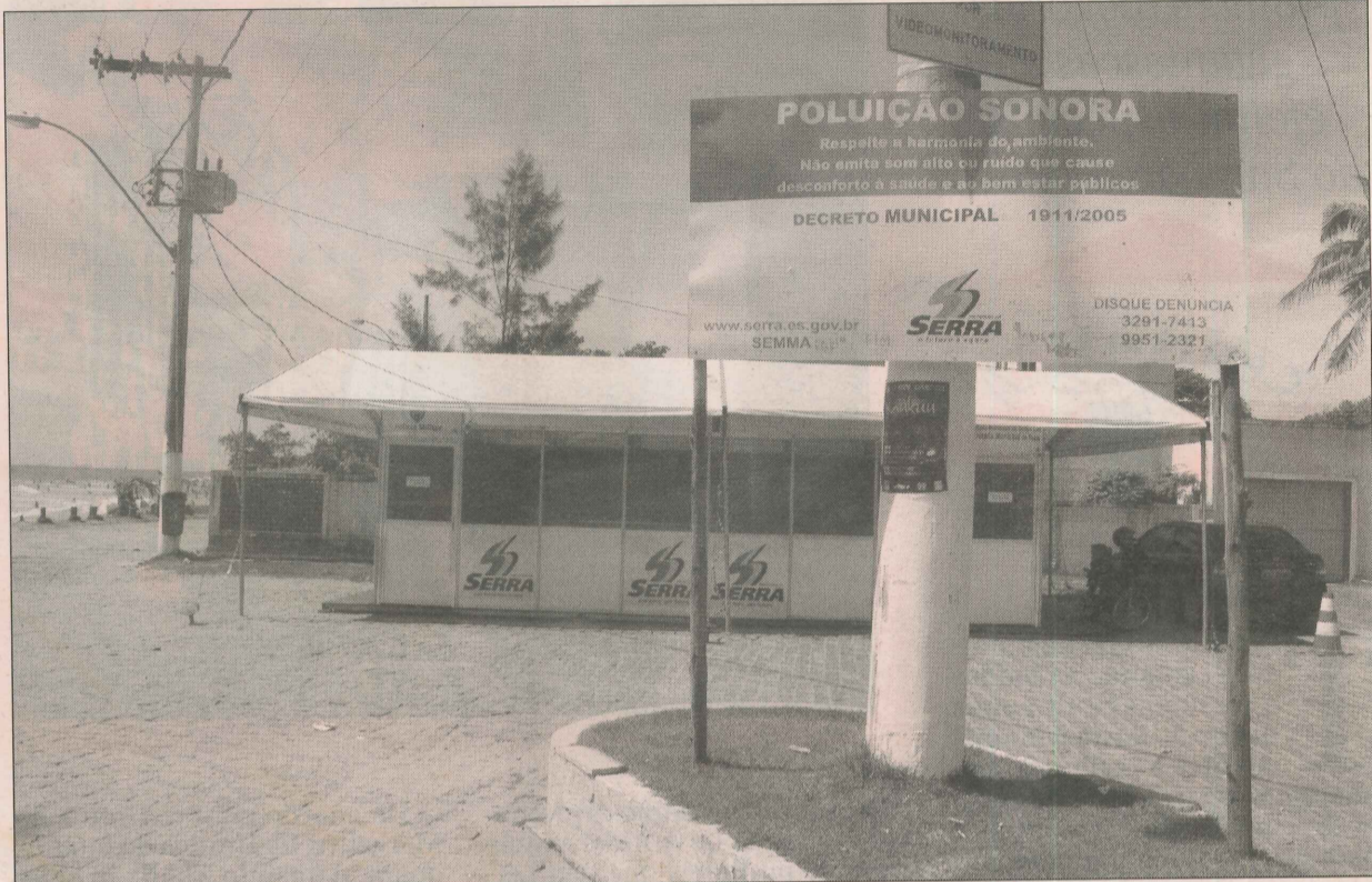
Placa alerta para a poluição sonora em Manguinhos, na Serra