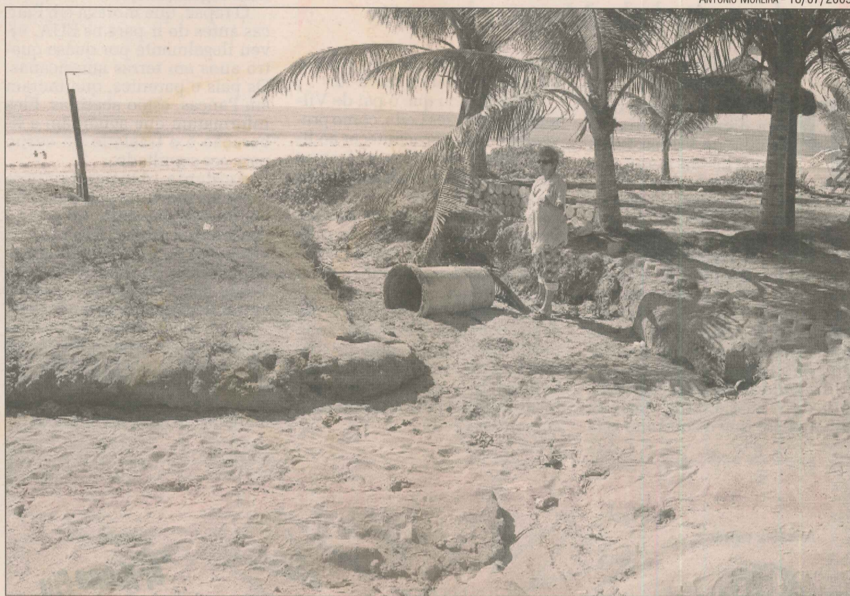
Erosão provoca buracos e acaba com vegetação de restinga na praia de Manguinhos

“O buraco começou no interior do meu comércio. Consertamos, mas agora está levando a área de cadeiras e mesas. A água da chuva é um dos principais agravantes”, observou Elba.