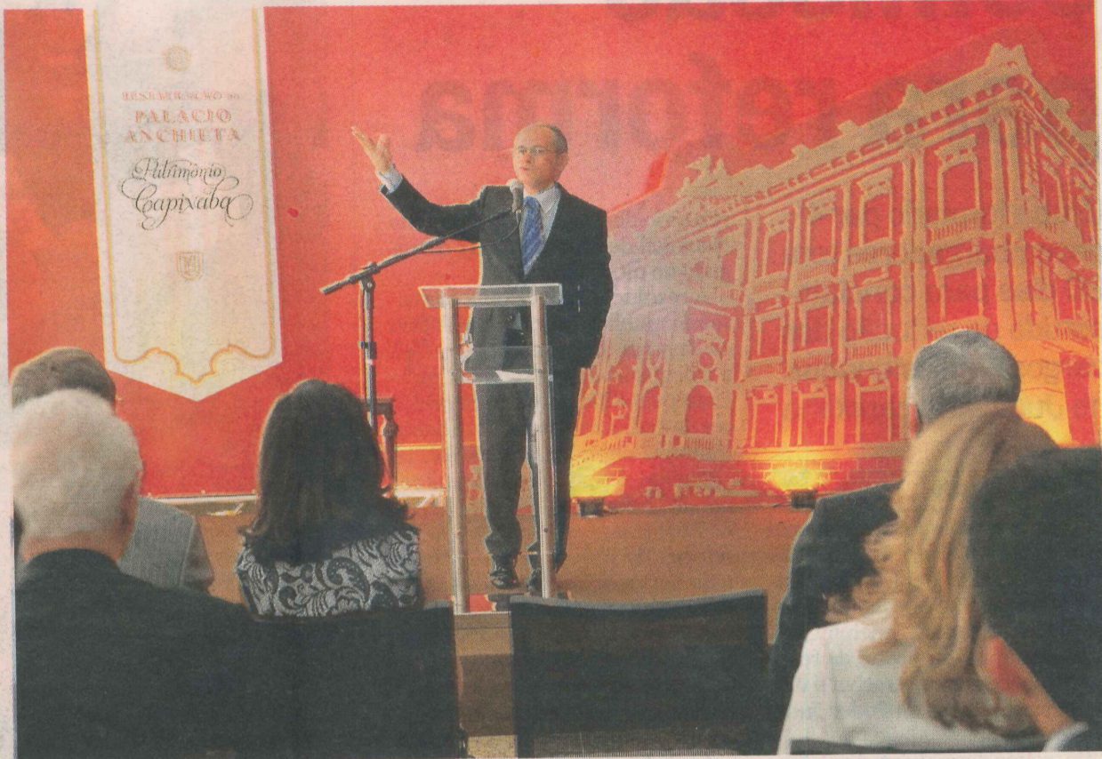
HARTUNG destacou em solenidade que a abertura do palácio à população servirá para resgatar a história capixaba