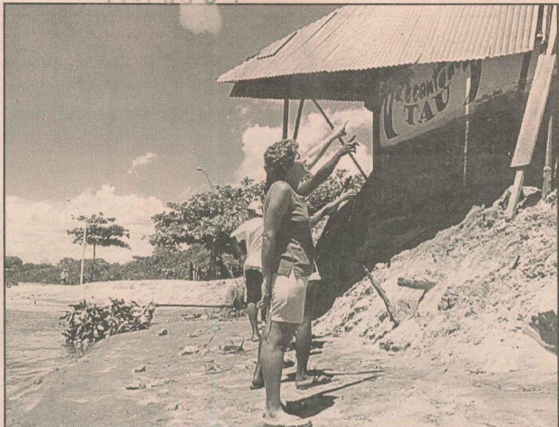
Quiosque parcialmente destruído pela erosão do mar