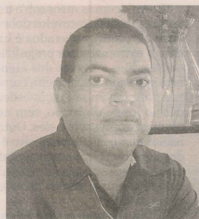
PAULO: hóspedes têm almoço