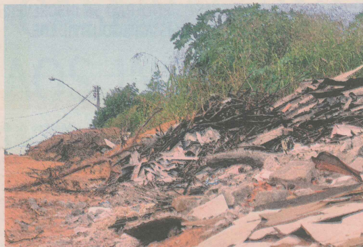
PROBLEMAS. População quer que a prefeitura cerque os terrenos para evitar que o lixo seja despejado.

pelos moradores é a falta de segurança. Segundo os moradores, por se tratar de um bairro tranqüilo, onde quase não se vê policiais circulando, os assaltos têm acontecido com frequência.