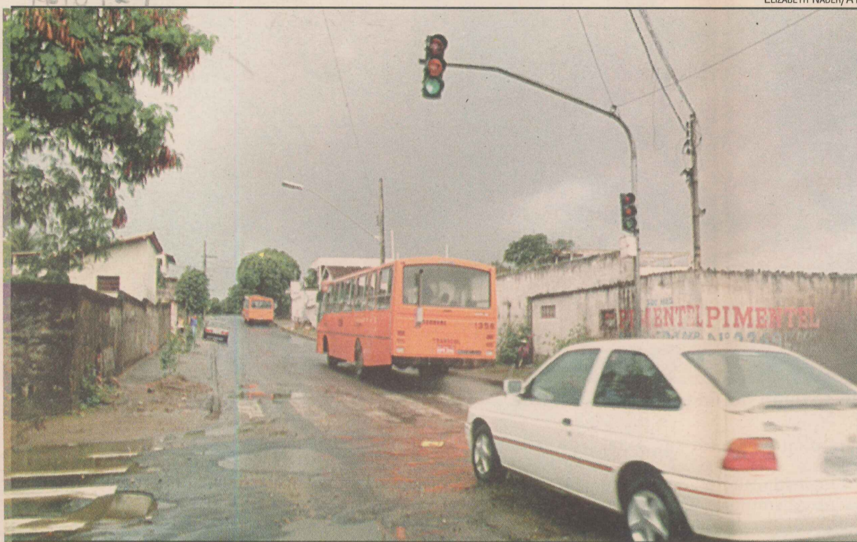
Rua movimentada no bairro Manoel Plaza: perigo para brincadeiras das crianças