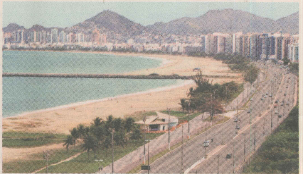
ENCONTRO. A Praia de Camburi será o local com maior movimentação durante a Caravana da Esperança.

O projeto fará arrecadação de alimentos, apresentações musicais e uma grande carreta pela ajuda ao próximo. Palestras com temas sociais serão apresentadas na Praia de Camburi, onde são esperadas mais de 20 mil pessoas. Confira os trajetos programados para a caravana.