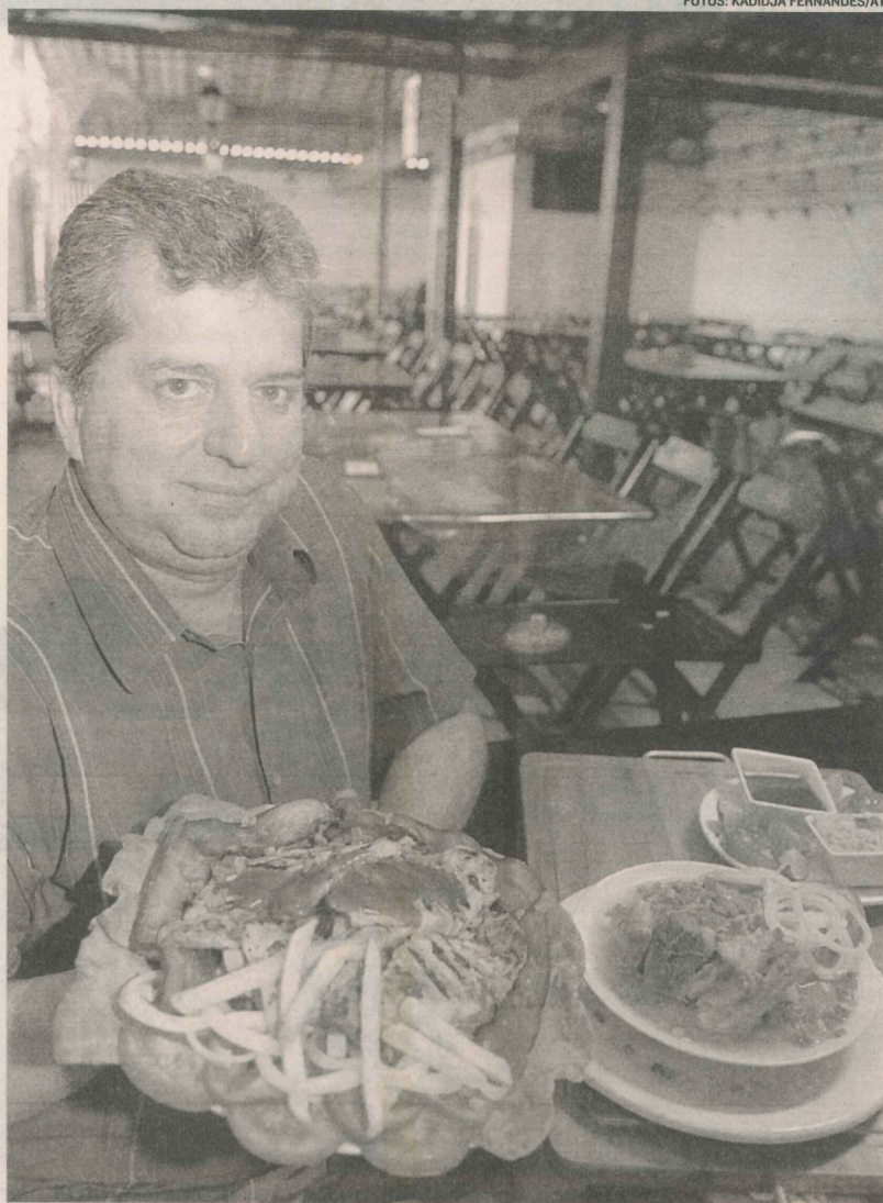
COSTELA NA ÁGUA e costelinha de porco são especialidades da casa