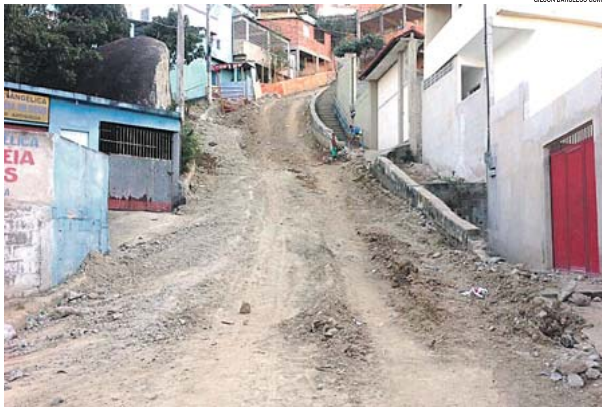
RUA José Martins, próxima ao Mirante, no Romão, passa por obras de reforma e está fechada ao tráfego

Acrescenta que, além da intervenção na rua, serão necessárias obras de contenções e guarda-corpos para garantir a estabilização das encos-