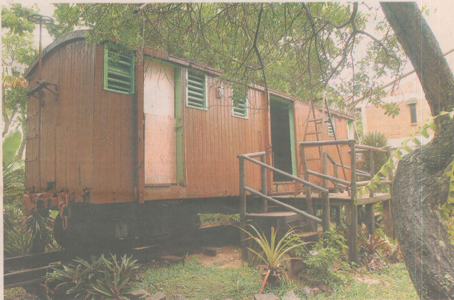
PONTOS FORTES. A construção do restaurante foi feita em eucalipto, vidros e tijolinhos, e o cardápio, baseado em petiscos e pratos tradicionais da cozinha regional.

O RESTAURANTE ESTAÇÃO 1ª DE MANGUINHOS É FAMOSO POR ABRIGAR EXPOSIÇÕES DE ARTE, RECITAIS DE POESIA E UM CARDÁPIO RECONHECIDO PELO GUIA QUATRO RODAS