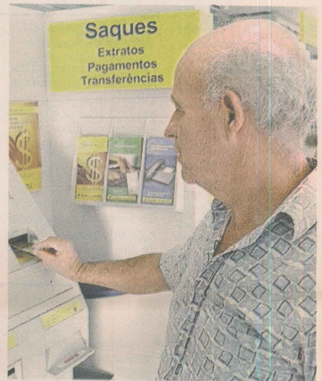
CENSO. Aposentados devem esperar chamada do banco para recadastramento.

prestar informações, nos bancos, quando receberem os pagamentos. Essas e outras informações estão disponíveis na Internet, no site do Ministério da Previdência Social ( www.mps.gov.br ) e nesta página, para tirar dúvidas e evitar corrida aos bancos à toa.