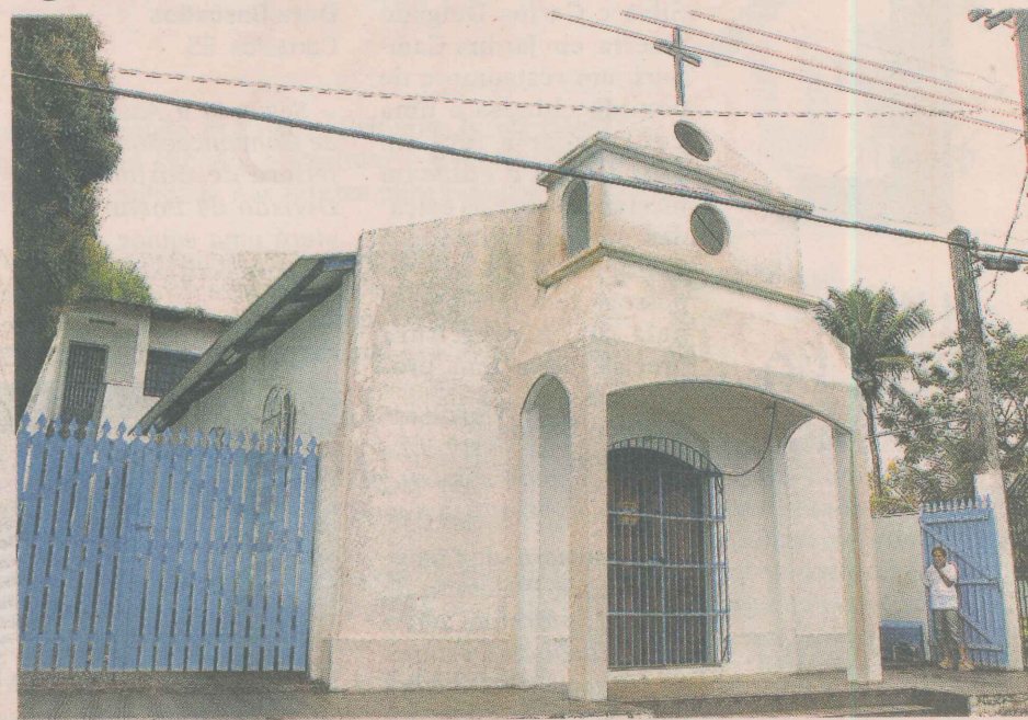
IMAGEM VEIO EM CANOA. Construída pela população local, a Igreja Católica Nossa Senhora de Sant'Ana também foi eleita pelos moradores como um dos orgulhos de Manguinhos. Ela foi benzida e inaugurada em 1887, com o nome de capela do Povoado de Manguinhos, abrigando imagens de Sant'Ana e São Sebastião. Contam que a imagem de Sant'Ana chegou a Manguinhos em canoas, através de uma procissão de pescadores. Atualmente, a igreja também realiza várias ações sociais.