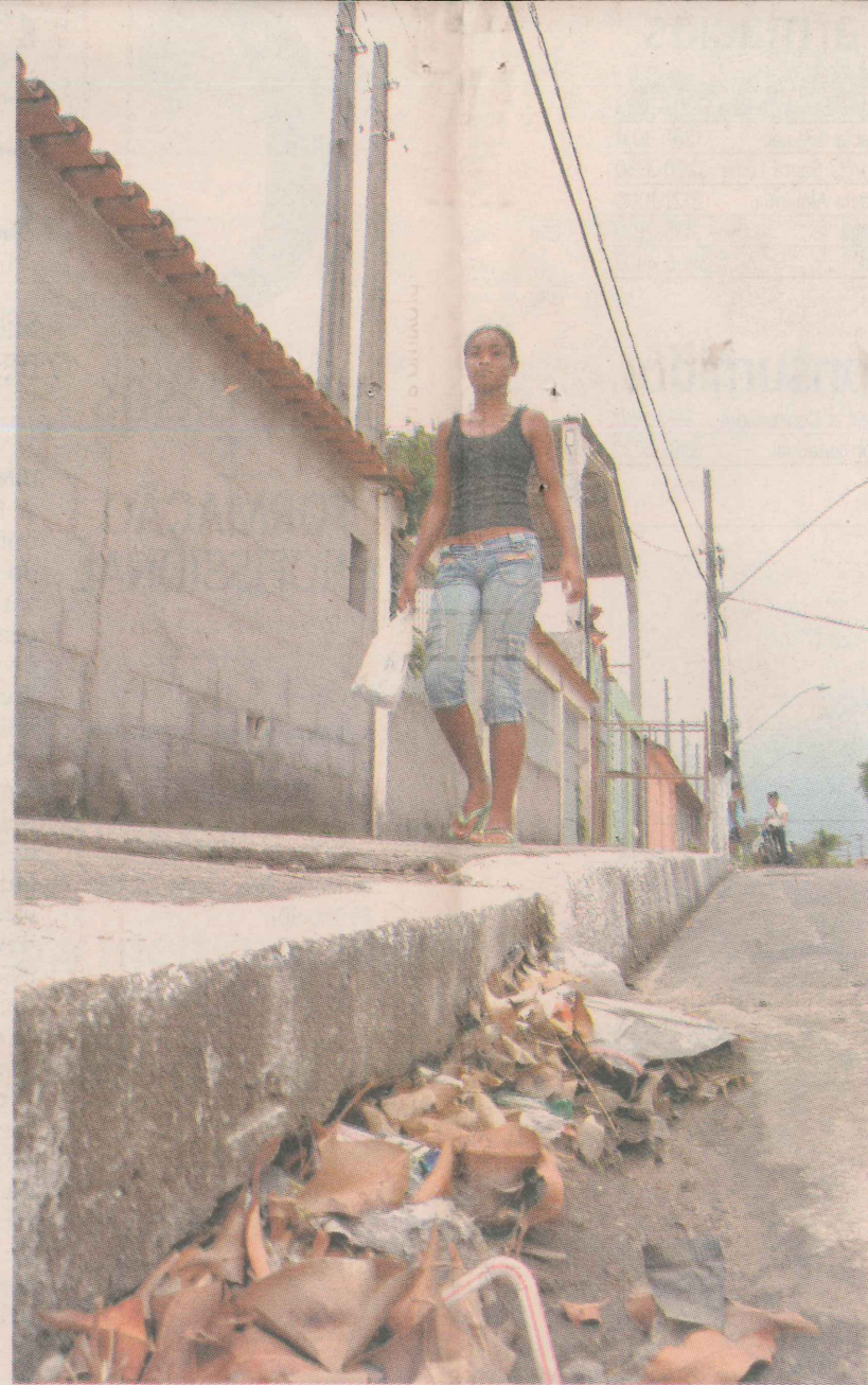
ENTUPIMENTO. Algumas ruas têm problema no calçamento por causa da água que fica empoçada quando chove.

TOME NOTA: Amanhã, veja quais são os orgulhos do bairro. E no sábado, o mapa ilustrado.