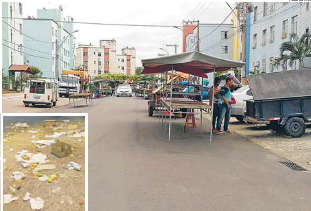
FEIRA LIVRE, em Castelândia, às terças-feiras, com montagem a partir das 12 horas e limpeza só às 5 da manhã

Por fim, pergunta sobre a fiscalização no entorno, pois no dia 26 de julho, um caminhão de venda de puffs fechou o seu veículo no estacionamento lateral, onde não acontece a feira.