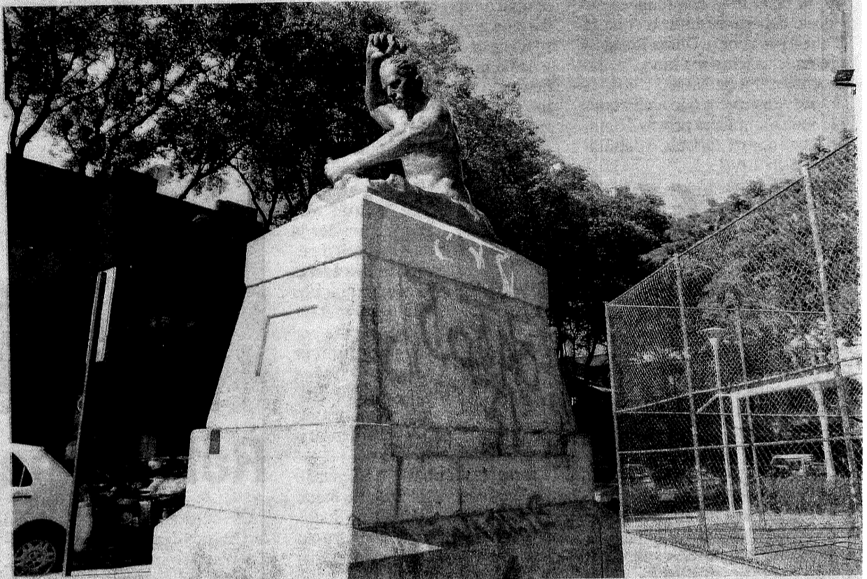
ESTATUA na Praça Ubaldo Ramalheite Maia, no Centro, está sem identificação e com pichações em todos os lados

Outro local com muros pichados é a Casa de Maria - Renovação Carismática Católica da Arquidiocese-