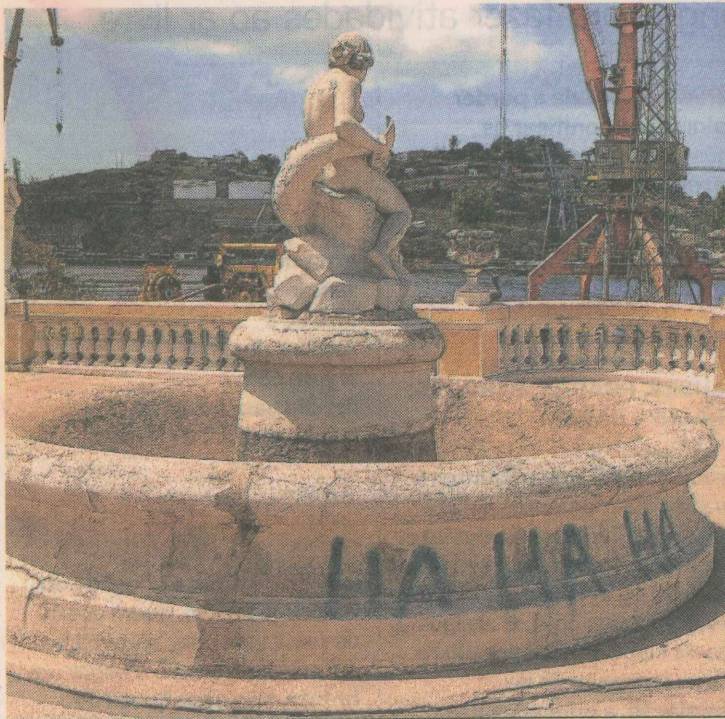
DESCASO. A Escadaria Bárbara Monteiro Lindenberg está quebrada; e as estátuas, pichadas. Até fezes foram encontradas no local