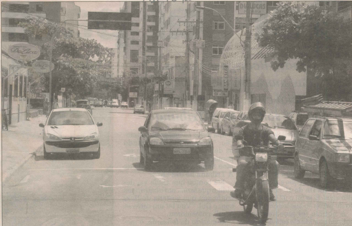
A avenida Hugo Musso é uma das mais movimentadas da Praia da Costa

As calçadas irregulares e a sujeira deixada por cães.