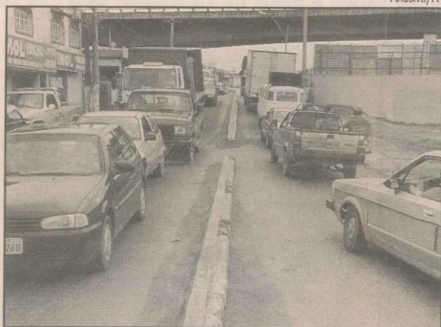
Na região da Ponte do Camelo, engarrafamento

Para usar o desvio, os carros vão passar por trás da Desportiva Ferroviária, até chegar à avenida Ana Merotto. A verba necessária para a implantação do projeto ainda não foi definida.