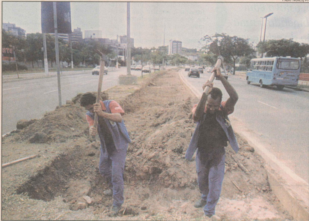
As obras na avenida Américo Buaiz, na Enseada do Suá, terminam no próximo dia 30

A baía de acesso à rua Celso Calmon receberá pequenas melhorias para permitir mais carros na fila. Esse projeto prevê, ainda, a construção de refúgios para ônibus, onde for tecnicamente possível.