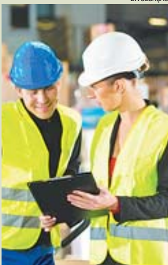
PRESTAÇÃO de serviços