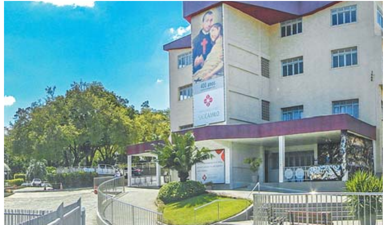
INSTITUIÇÃO DE ENSINO conta com três unidades, duas em Cachoeiro de Itapemirim e uma em Vitória

O Centro Universitário São Camilo tem 60 cursos, entre graduação e pós-graduação, e para 2016 a instituição se prepara para oferecer novos cursos. “Estamos traba-