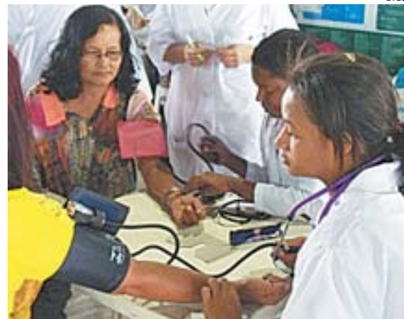
ALUNOS DA ETEC participam de ação comunitária conferindo a pressão arterial e nível de glicose das pessoas interessadas