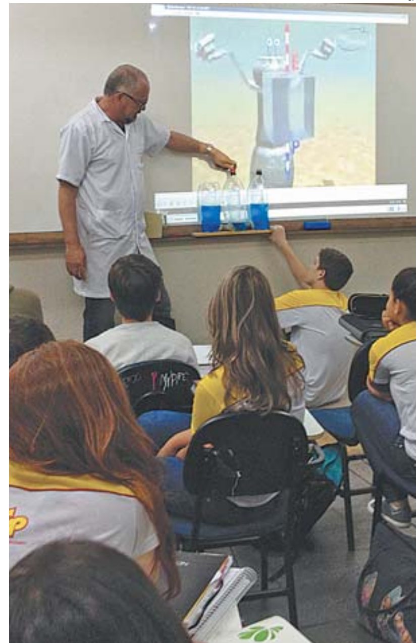
AULAS DE REVISÃO em sala de aula nas semanas que antecedem o Enem