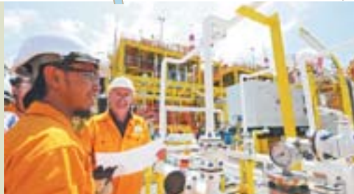
PROFISSIONAIS mais qualificados na indústria

INDÚSTRIA 4.0 - nova revolução industrial com a automação comandada por redes de computadores. É a fábrica inteligente, cria outros segmentos, um componente novo, novas demandas.