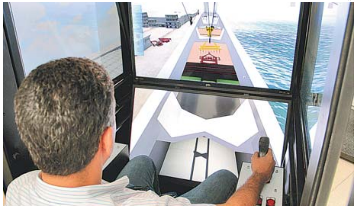
ESTUDANTE durante simulação feita em laboratório. Faculdade tem infraestrutura para projetos de pesquisa

O diretor observou que os alunos têm infraestrutura de laboratórios de eletrônica e microprocessadores e até robô industrial para usar nos projetos.