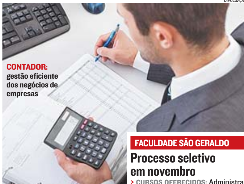
CONTADOR: gestão eficiente dos negócios de empresas

“Sem o contabilista, é impossível ter uma gestão eficiente dos negócios, especialmente em um momento de crise econômica. Ele deve entender da legislação fiscal, trabalhista, tributária e previdenciária. Pensando na importância de