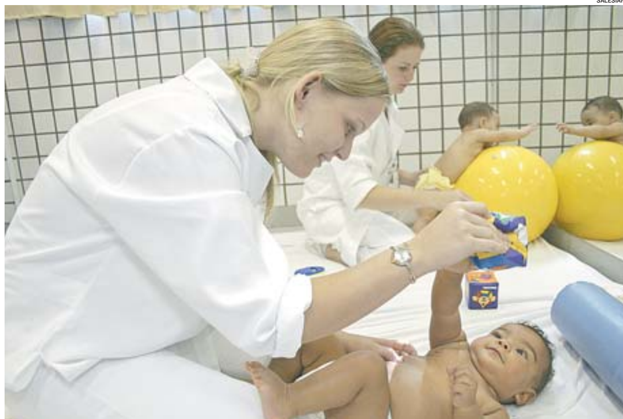
A ÁREA DE SAÚDE da Faculdade Salesiana vai contar com novas opções de curso na pós-graduação

Também são realizados os chamados “projetos integradores”, com estudo de campo. Os alunos observam, fazem diagnóstico e propõem intervenções.