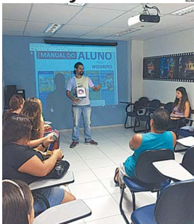
ALUNOS em sala: escola oferece ensino de línguas para adultos e crianças

“Quer seja para continuar empregado, quer seja para conquistar uma oportunidade de trabalho ou buscar ascensão. Certamente, outro idioma dará um lugar de destaque profissionalmente, pessoalmente, socialmente e culturalmente”, disse.