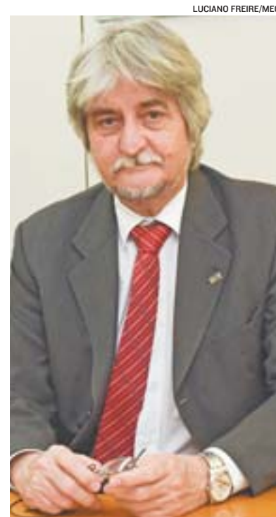
RISTOFF: mais chance de formação

Pode fazer inscrição quem não zerar a redação. O candidato pode escolher até duas opções entre as vagas.