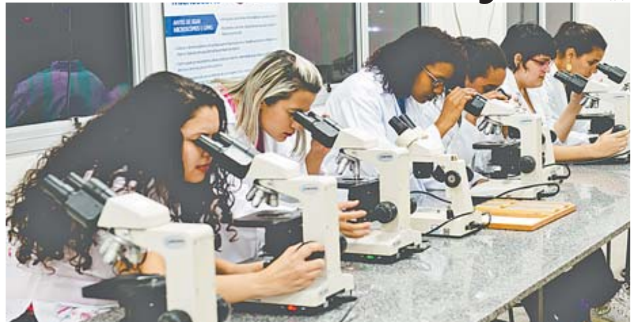
FACULDADE OFERECE laboratórios, como o de Ciências Biológicas, onde os alunos podem praticar o que aprendem

Além disso, são feitas visitas técnicas e acompanhamento de projetos em andamento para que saia com vivência prática. Também destacou a importância da pesquisa para ampliar o conhecimento e encontrar soluções para problemas reais do cotidiano.