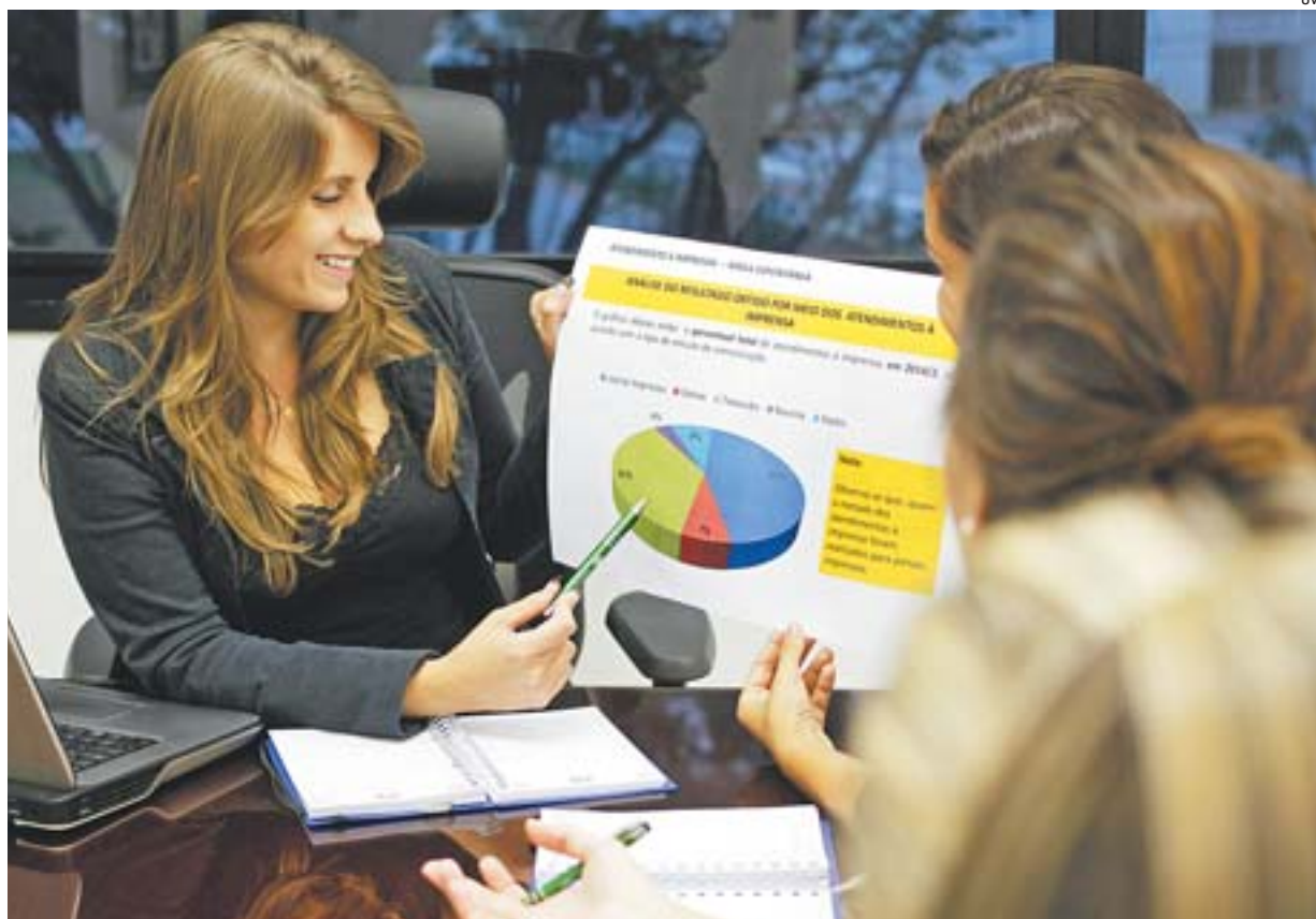
ÁREAS DE COMUNICAÇÃO E MARKETING estão entre as que possuem oferta de cursos de pós-graduação

Os alunos de pós na Fucape, por exemplo, são em sua maioria pro-