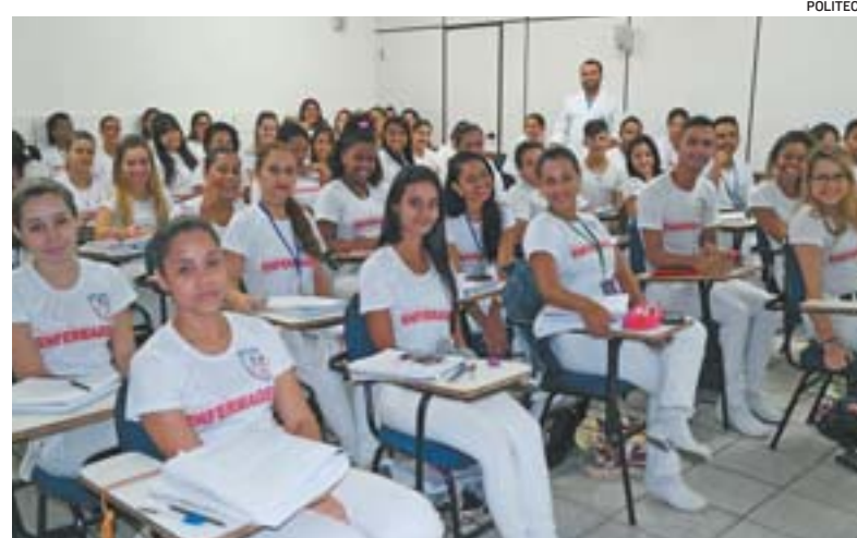
TURMA do curso técnico de Enfermagem: porta aberta para graduação