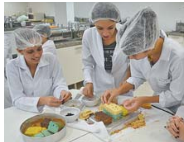
AULAS PRÁTICAS e projetos de extensão fazem parte do dia a dia dos alunos da faculdade, por exemplo, do curso de Nutrição

Os alunos, por exemplo, de Nutrição, têm aulas práticas. Com ações interdisciplinares, os cursos de graduação têm atividades com adolescentes, jovens, idosos e mulheres chefes de família de comunidades do entorno da faculdade. É o Projeto de Extensão da Católica, que assiste moradores do Morro do Romão e Forte São João com demandas referentes à saúde, moradia e qualificação profissional.