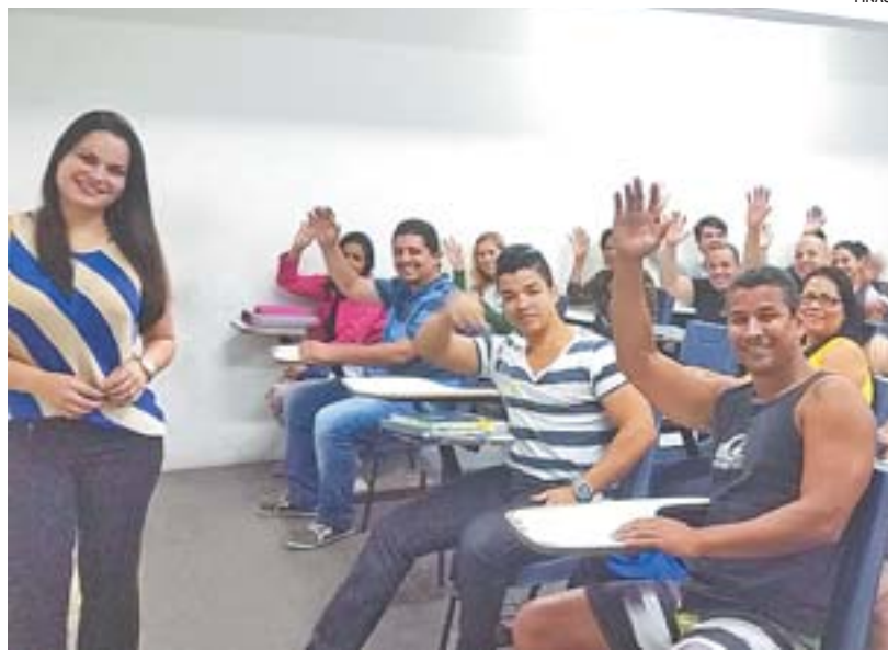
ALUNOS E SEUS FAMILIARES são incentivados a continuar os estudos