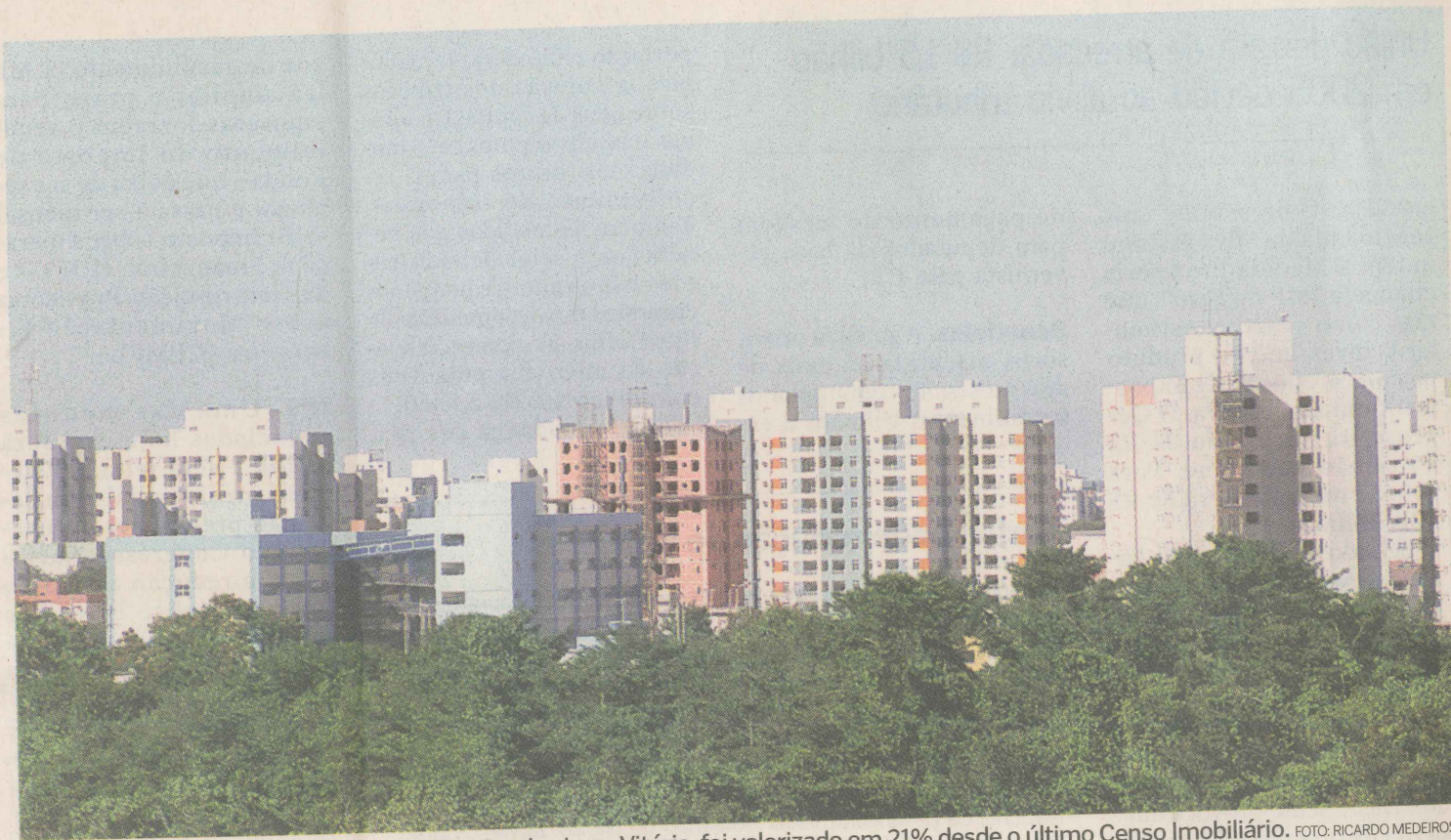
CRESCIMENTO. O preço do imóvel em Jardim Camburi, em Vitória, foi valorizado em 21% desde o último Censo Imobiliário.

Algumas regiões registraram valorização superior a 13% nos últimos seis meses. De acordo com o presidente