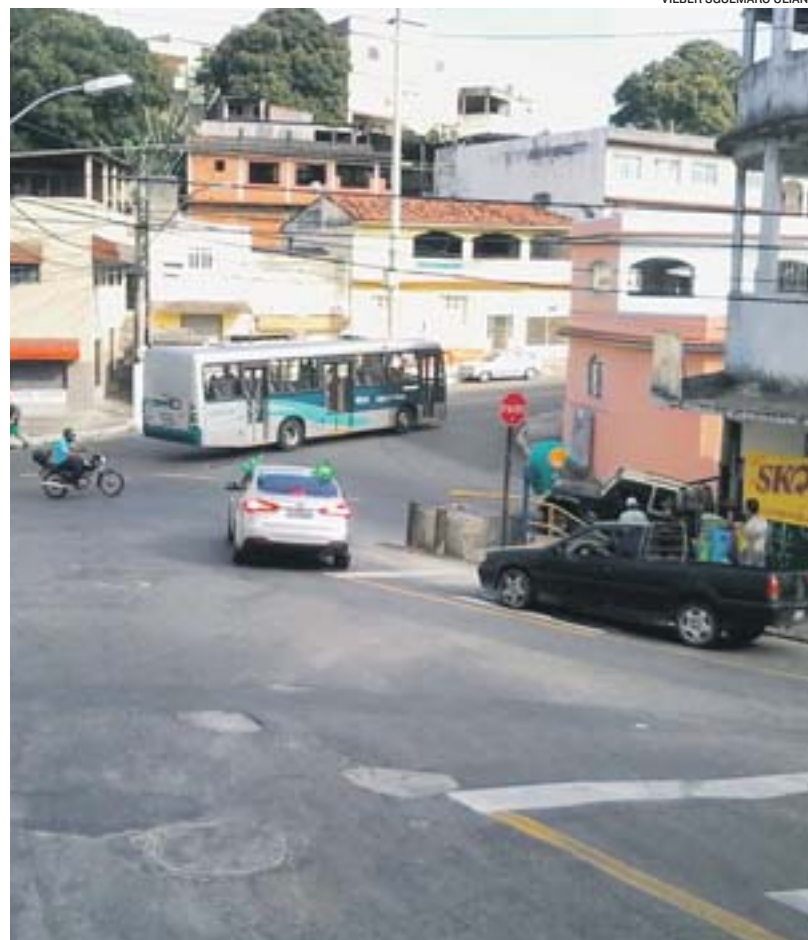
CRUZAMENTO sem rotatória que é considerado perigoso em Caratoíra