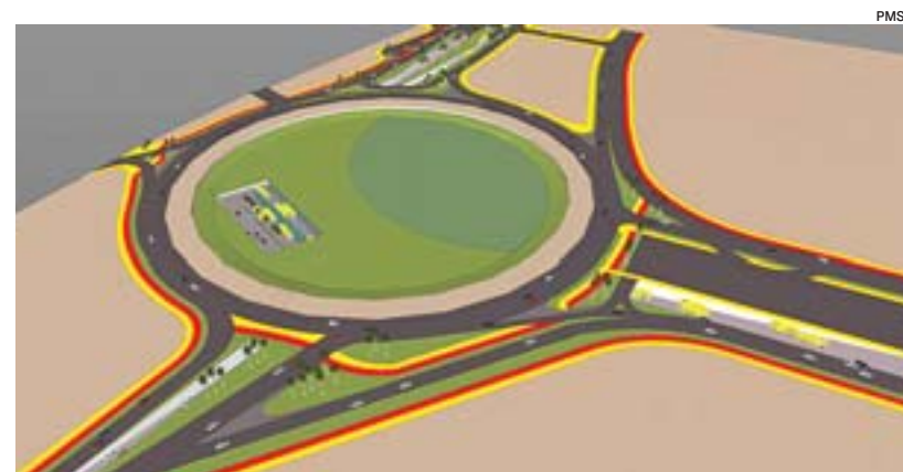
PERSPECTIVA da mudança na rotatória do Hospital Dório Silva