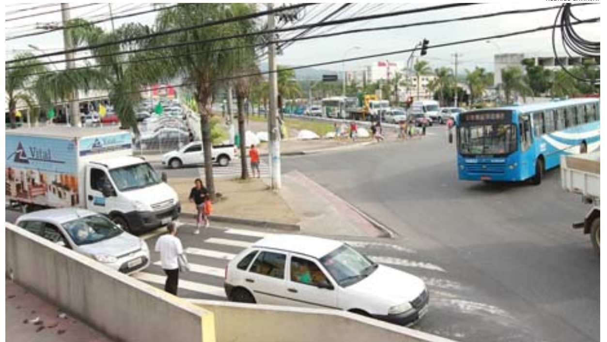
CRUZAMENTO da avenida João Palácios com a BR-101, em Carapina, na Serra, vai ter menos semáforo

“Vamos retirar um semáforo da região nas proximidades do Vitória Apart Hospital. Quem vier pela BR-101 e for para Bairro de Fátima vai passar por baixo da rodovia, sem precisar esperar por um semáforo. Isso ajuda a reduzir o trânsito.”