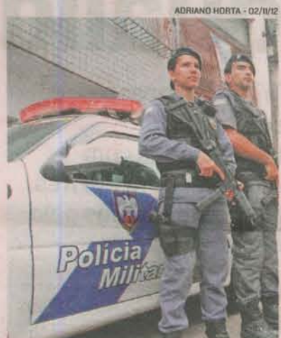
NOVAS contratações em 2013