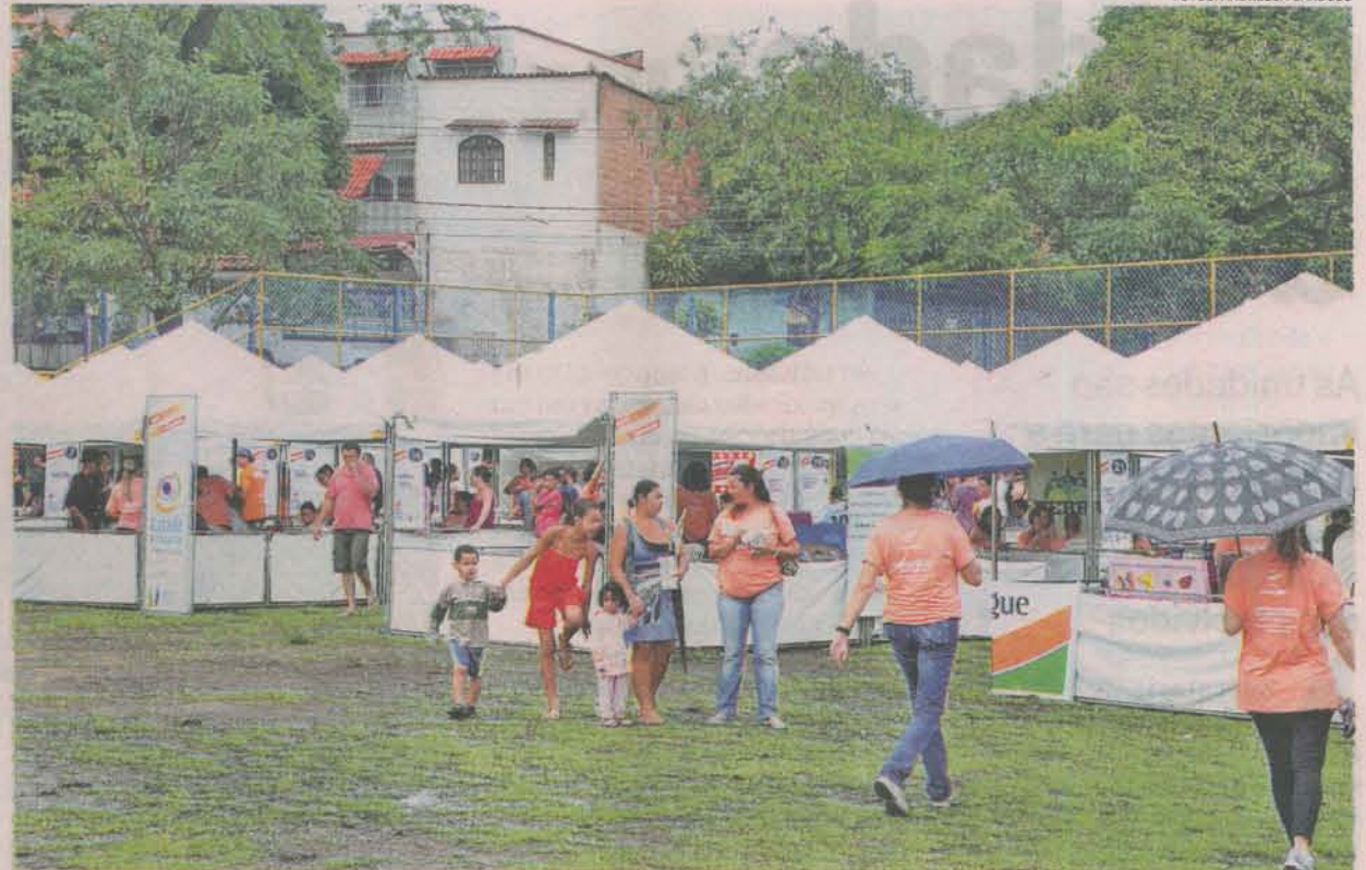
AÇÃO INTEGRADA NO BAIRRO BONFIM, em Vitória. Durante o evento foram realizados 14.516 atendimentos

A Banda de Música da Polícia Militar apresentou um repertório variado, com música popular brasileira. Músicas de Ivete Sangalo e Skank fizeram parte do concerto. A comunidade também contou com orientação jurídica e entretenimento com apresentações culturais.