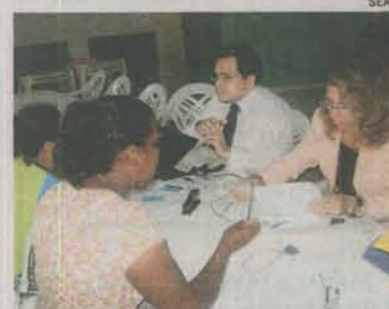
DEFENSORIA Itinerante em Pinheiros

O serviço será referência para dependentes de drogas na região, com acesso facilitado aos pacientes e seus responsáveis, que poderão ligar direto para o Centro para agendar avaliação por uma equipe interdisciplinar. Esta, junto com o usuário, vai definir o perfil clínico e o projeto terapêutico necessário para cada um.