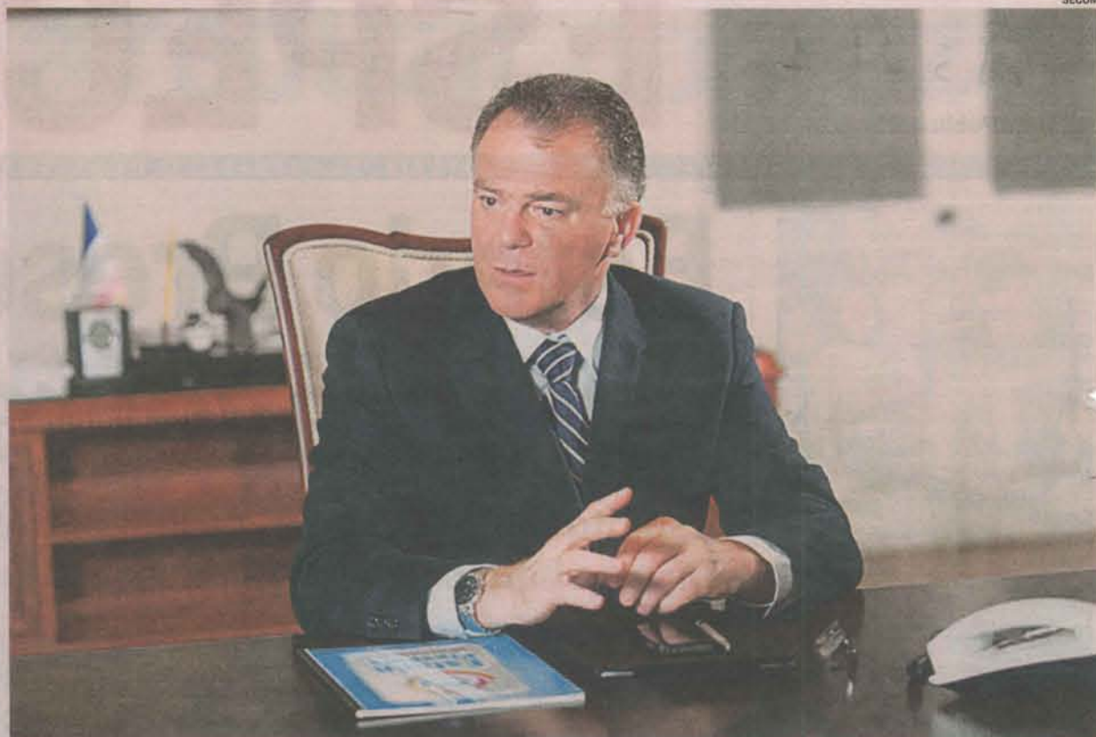
CASAGRANDE destaca a programação de investimentos em vários setores nas áreas atendidas pelo programa

O conceito de vulnerabilidade social adotado pelo Programa Estado Presente não se limita à concepção de pobreza. Refere-se ao conjunto de fatores socioeconômicos e demográficos capazes de reduzir o nível de bem-estar de uma determinada população, em consequência de sua exposição a determinados tipos de riscos.