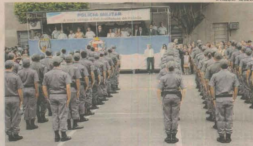
AUMENTO no efetivo da PM: mil novos policiais foram contratados