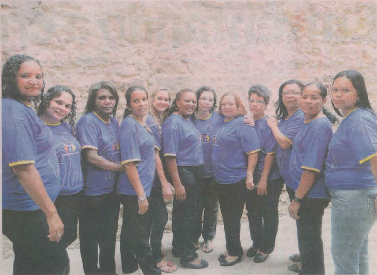
MULHERES que conhecem bem a realidade dos bairros têm papel de liderança no projeto Coordenadores de Pais