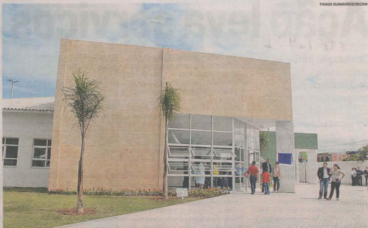
UNIDADE DE SAÚDE DA FAMÍLIA inaugurada recentemente em Barramares, bairro atendido pelo Estado Presente

O objetivo da iniciativa, criada pela Secretaria de Estado da Saúde (Sesa), é ajudar na reestruturação da atenção básica municipal, onde é feito o primeiro atendimento ao paciente. Quando esse acompanhamento é bem estruturado, esti-