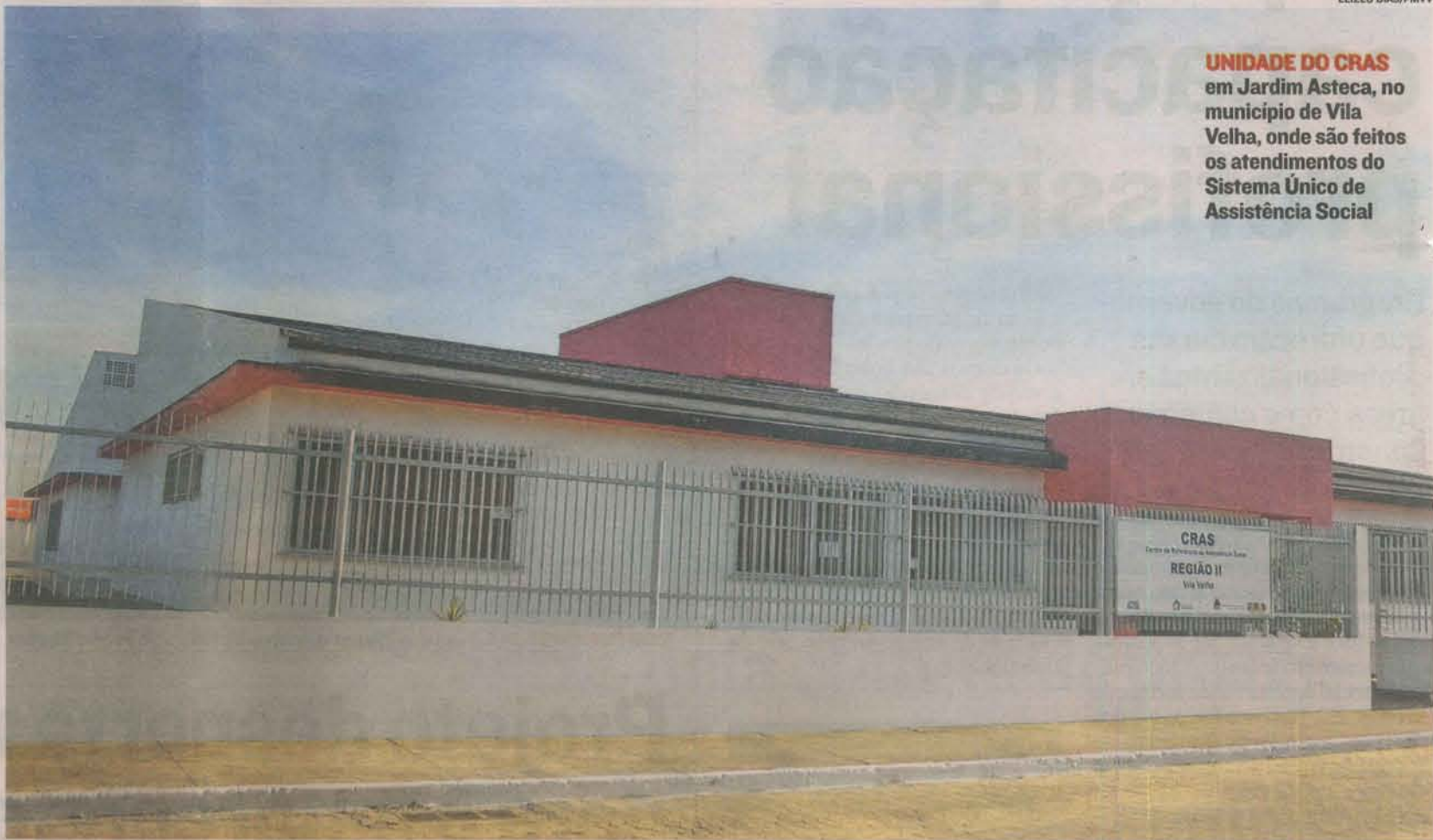
UNIDADE DO CRAS em Jardim Asteca, no município de Vila Velha, onde são feitos os atendimentos do Sistema Único de Assistência Social

O Programa Incluir visa estruturar, por meio da articulação de políticas públicas, uma rede de ações e projetos que incentivem o acesso