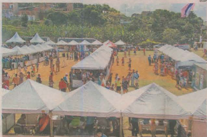
AÇÃO INTEGRADA pela cidadania leva serviços essenciais a comunidades

Os resultados já mostram a diminuição de homicídios e isso é um sinal de que o programa está produzindo os primeiros efeitos.”