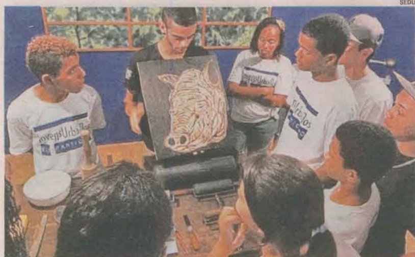
JOVENS que participam do projeto em visita ao Museu de Arte do Estado