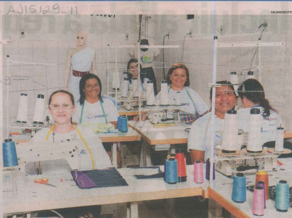
CORTE E COSTURA é um dos cursos disponibilizados pelo Profic Mulher, com grande procura

Jadir Péla, secretário de Estado de Ciência, Tecnologia, Inovação, Educação Profissional e Trabalho