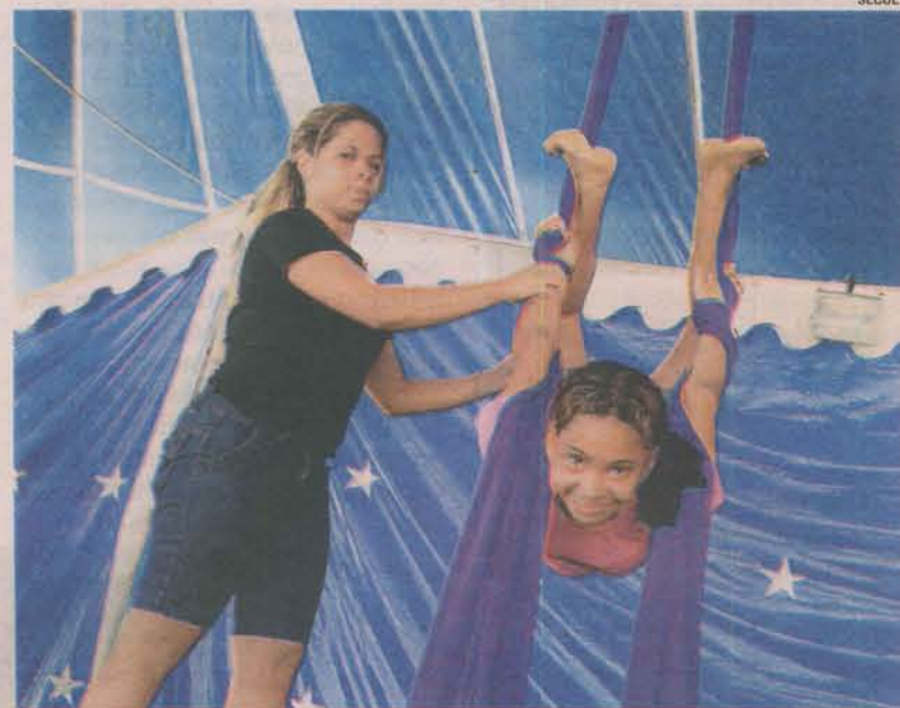
ALUNA aprende exercícios e técnicas de espetáculo do circo

Dentro da programação do Projeto Cultura Presente também es-