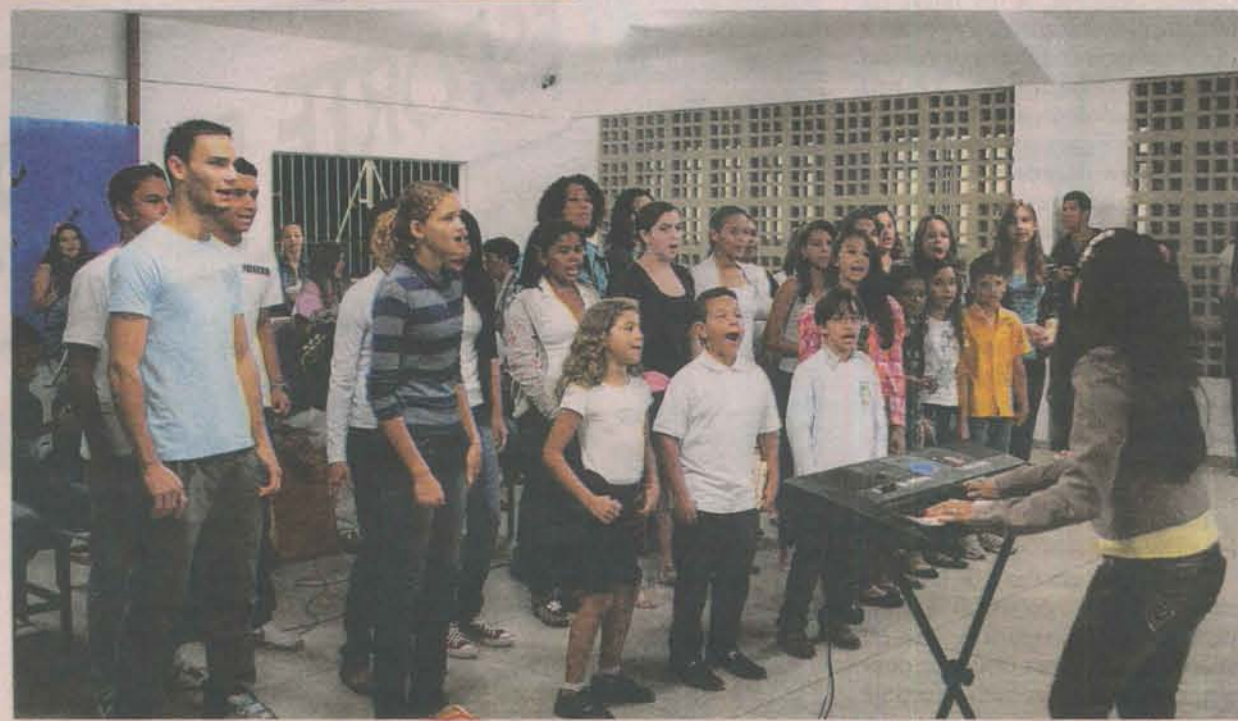
AULAS DE MÚSICA para crianças e adolescentes: projeto visa potencializar as habilidades de cada participante