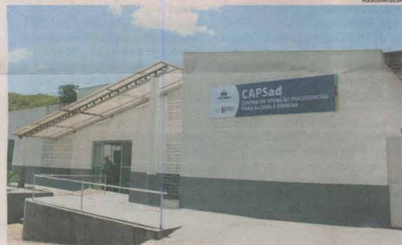
CENTRO inaugurado este ano em Cachoeiro pode atender até 190 pessoas