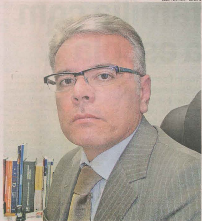
ANDRÉ GARCIA: “Menor número de homicídios registrado desde 1997”

“No próximo ano haverá a expansão do Programa Estado Presente para 10 municípios do interior, sendo um no Sul e nove no Norte”