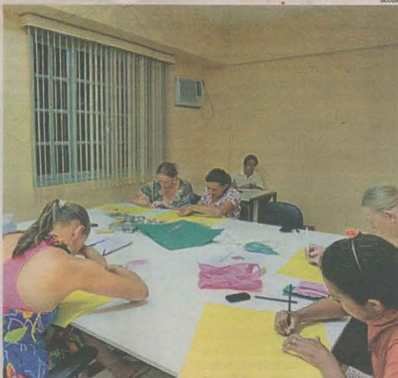
ARTESANATO é uma das opções oferecidas no Cras para geração de renda