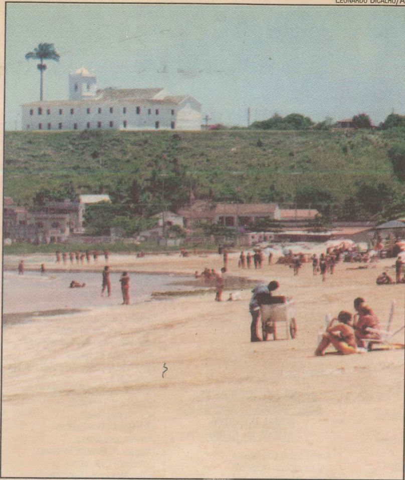
Projeto prevê urbanização da orla de Nova Almeida