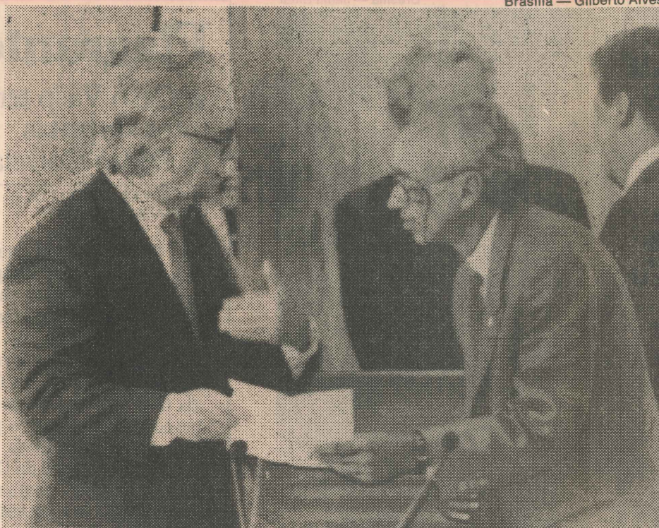
Brasília — Gilberto Alves

BRASÍLIA — O presidente Itamar Franco reconheceu ontem, durante a segunda reunião ministerial de seu governo, que o Brasil vive "um estado de emergência social". Itamar ficou impressionado com a exposição da ministra do Planejamento, Yeda Crusius, e do sociólogo Herbert de Souza, o Betinho, que entregaram aos presentes o mapa da fome , que registra um total de 32 milhões de pessoas ou nove milhões de famílias vivendo na indigência, com renda para no máximo uma cesta básica por mês — população equivalente à da Argentina e quase à da Espanha.