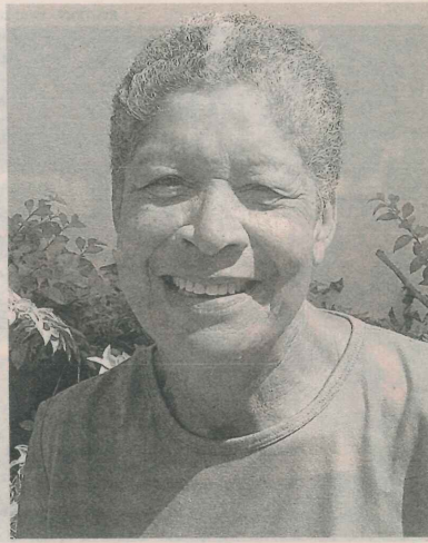
BÊNEDITA: orgulho do bairro

Ele disse que se adaptou à região e que não abandona o local.