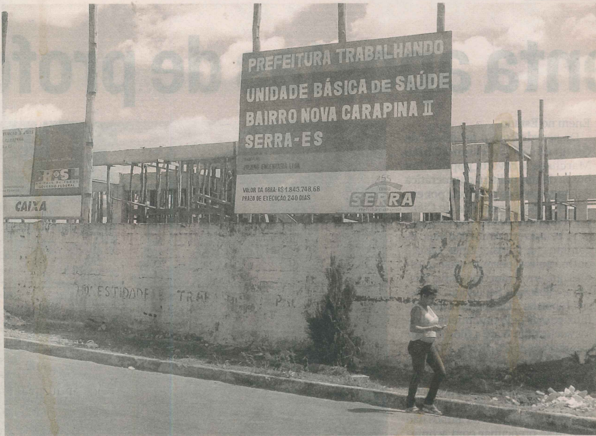
OBRA DO POSTO DE SAÚDE deve ficar pronta no final do ano que vem. Área ocupada é de 777,6 metros quadrados