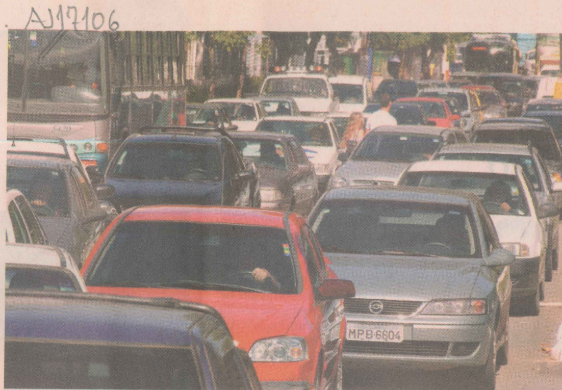
SATURAÇÃO. Na Capital, congestionamentos ocorrem com frequência.

Para a população, o principal problema no trânsito é o engarrafamento. Em segundo lugar está o desrespeito às leis de trânsito, o que confirma a par-