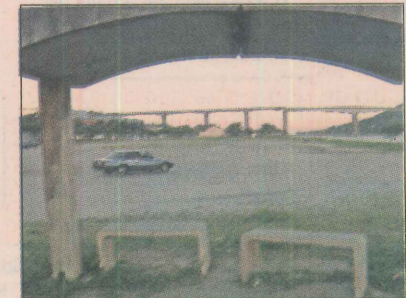
Área que pertence ao Estado