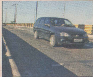
Ponte de Camburi: nova faixa

Houve grandes congestionamentos, principalmente nos horários de pico.