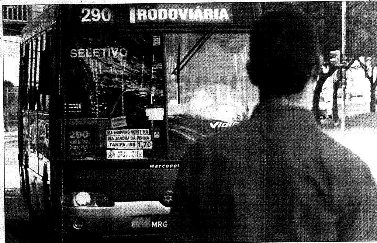
Passageiro pega a linha 290, que será desviada para ruas de Jardim da Penha e Praia do Canto

Linhas que passam por Paul, em Vila Velha, Porto de Santana