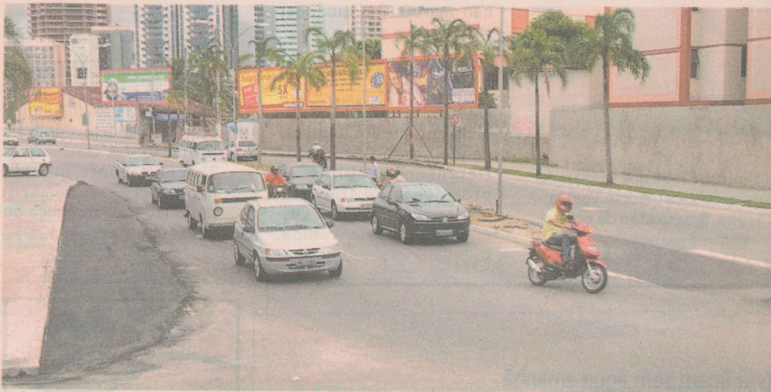
SAÍDA. O alargamento da saída da Ponte Ayrton Senna, em Jardim da Penha, servirá para receber quase todo o fluxo de carros que hoje passa pela Ponte de Camburi.

■ Barro Vermelho. A Rua Dom Pedro II, que liga a Rua da Grécia ao cruzamento das ruas Rio Branco e Afonso Cláudio, e a ladeira do Barro Vermelho ficam prontas neste fim de semana. A Dom Pedro II virou de mão única no sentido praia.