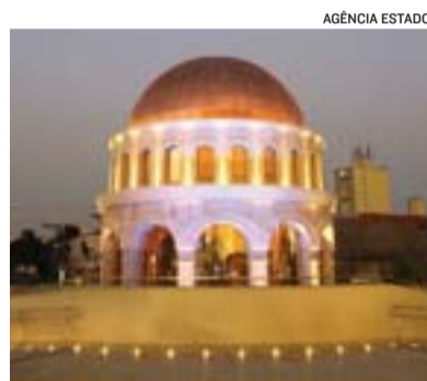
VISTA do Templo de Salomão

O Ministério Público de São Paulo, porém, apura suspeitas de irregularidades na emissão do alvará que liberou as obras.