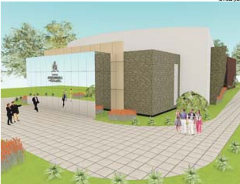
PROJEÇÃO da Igreja Adventista do Sétimo dia, em Colatina. Obras até 2015