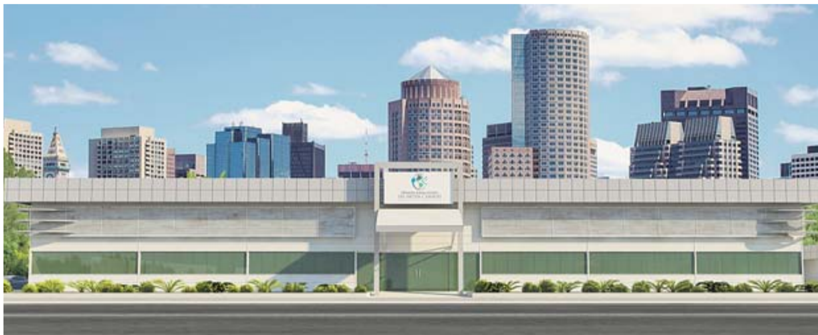
TERRENO , na região de Santa Terezinha, onde será construída a Primeira Igreja Batista de Jardim Camburi, com capacidade para receber 3 mil pessoas

Na capital, há várias igrejas sendo construídas. Uma delas é o Centro de Celebrações e Eventos da Primeira Igreja Batista de Jardim Camburi, que terá um auditório para 3 mil pessoas e ficará na região do bairro Santa Terezinha.