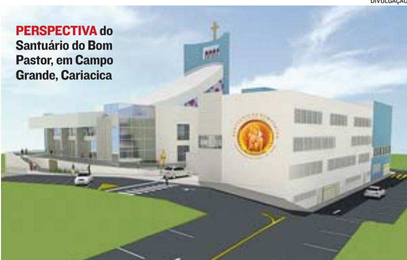
PERSPECTIVA do Santuário do Bom Pastor, em Campo Grande, Cariacica