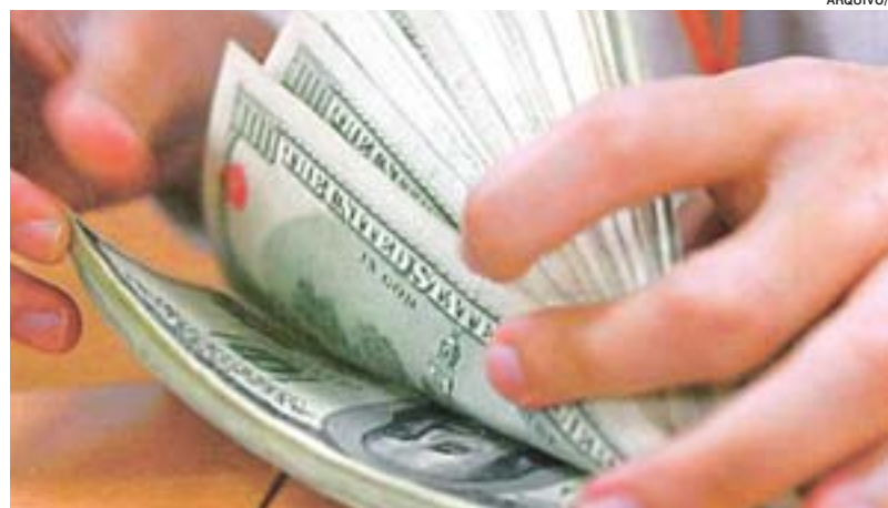
INVESTIDOR conta dólares: menos pessoas com mais de US$ 30 milhões