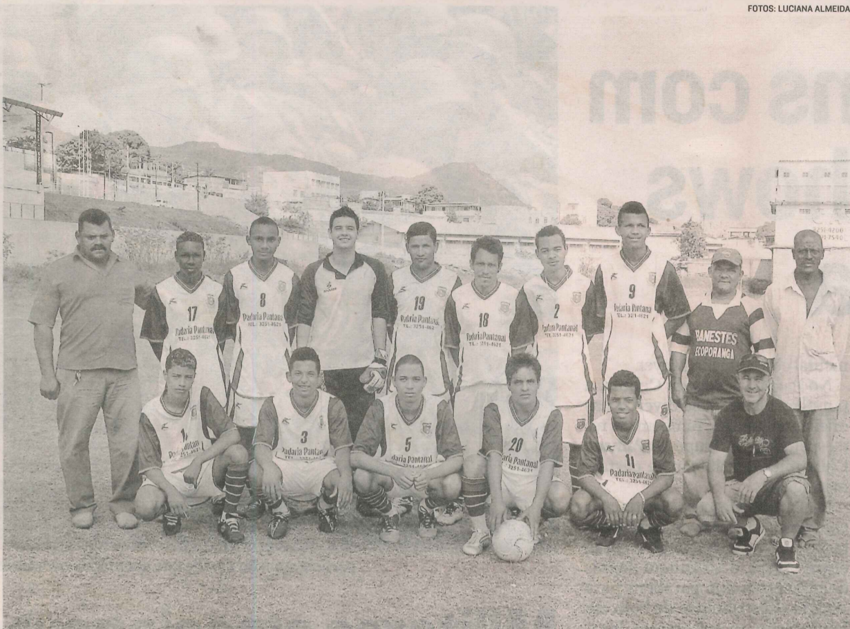
JOGADORES do União Futebol Clube, que foi fundado em 1993 e hoje conta com equipes de jovens e veteranos