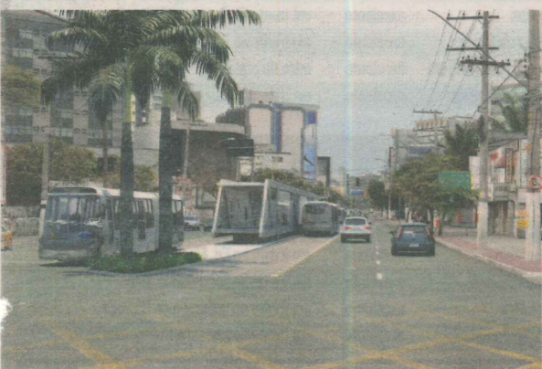
PROJEÇÃO mostra como vai ficar o corredor exclusivo para ônibus em Vitória

A Prefeitura da Serra conta com plano de construção e alargamento de avenidas.