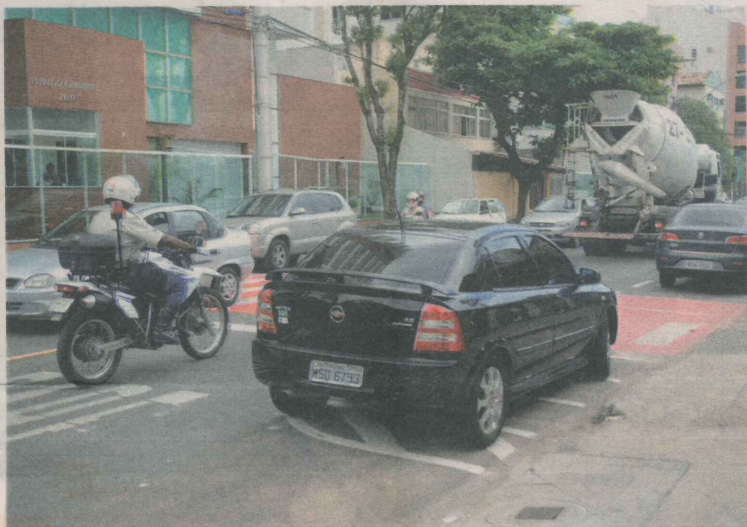
RUA CARLOS MARTINS, uma das principais do bairro, deve mudar