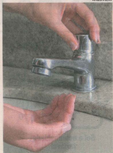
TORNEIRAS secas durante o dia