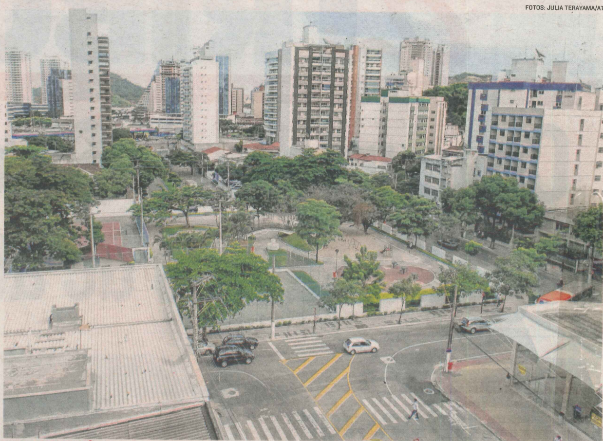
PRAÇA DO CAUÊ vai ter mais um acesso após prefeitura anunciar mudança no sentido da rua Pinto Aleixo

Haverá ainda cinco travessias de pedestres semaforizadas nos cru-