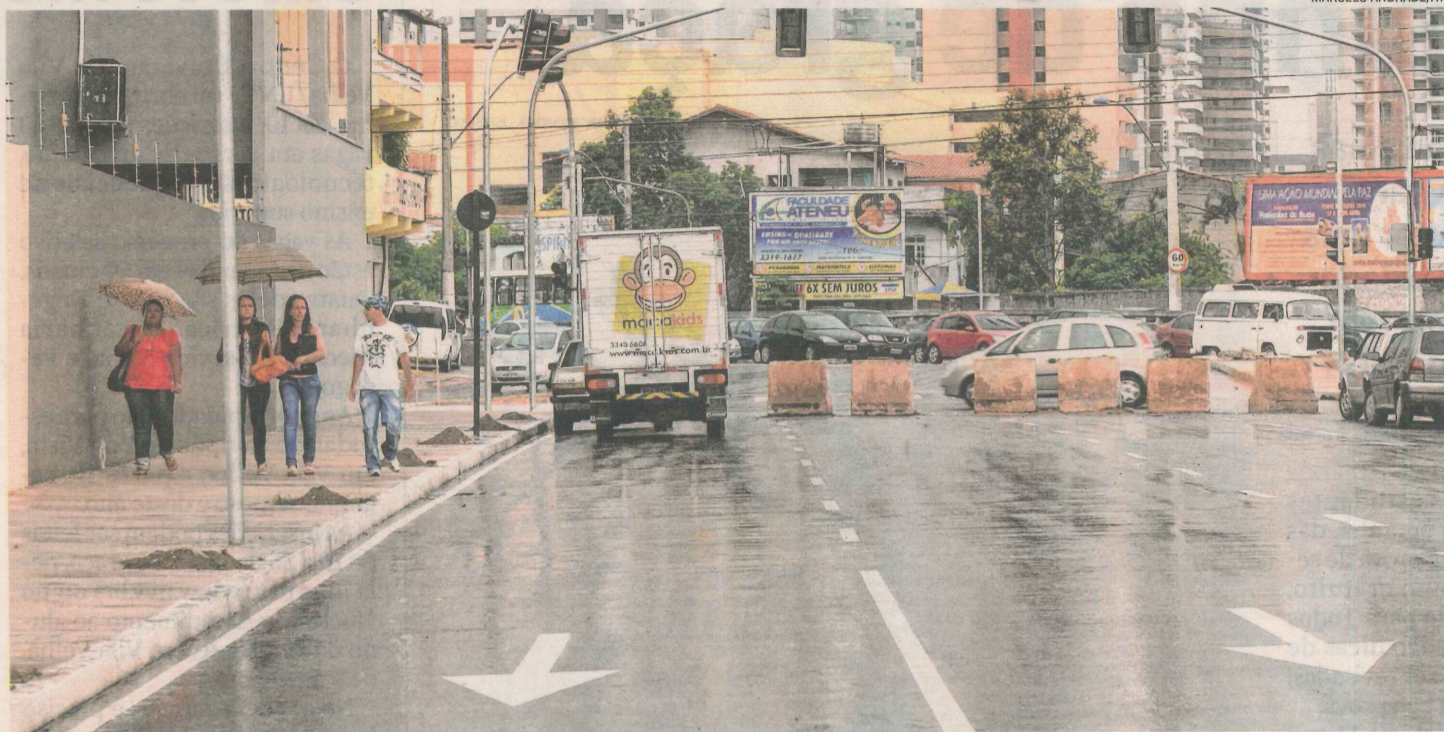
A RUA EUROPA, nas imediações do Terminal de Vila Velha, vai ser aberta para quem descer da Terceira Ponte. Mudanças passam a valer a partir da próxima terça-feira

A partir das 23 horas da próxima segunda-feira serão feitas as alterações finais da obra, como recapeamento e sinalização horizontal e vertical. Para isso, o trânsito na