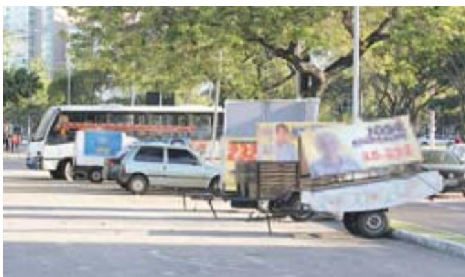
REBOQUES com placas de propagandas políticas ficam parados em vagas na Praça dos Namorados.