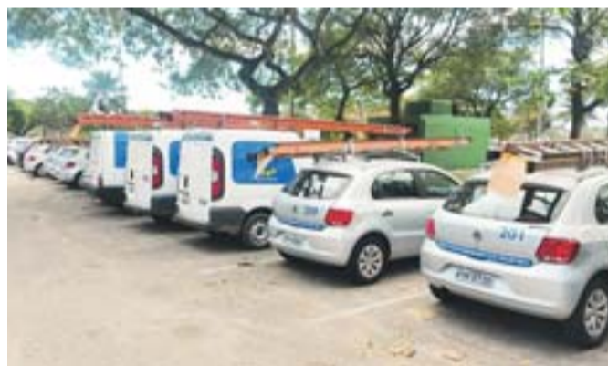
UMA FROTA DE VEÍCULOS de uma empresa estava estacionada na Praça dos Namorados.