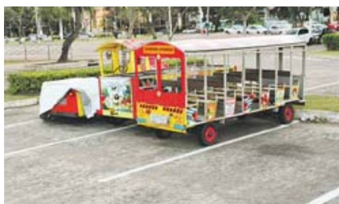
O TRENZINHO que é usado para transporte de crianças durante o fim de semana ocupa vagas na Praça dos Namorados.