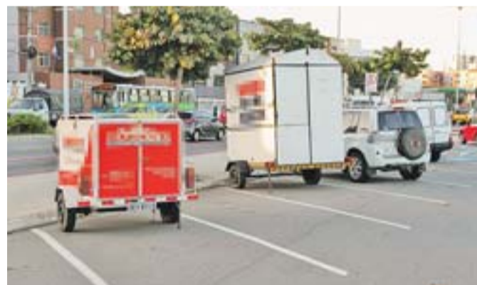
TRAILERS DE EMPRESAS ficam estacionados na praia de Camburi, reduzindo as vagas disponíveis para motoristas.