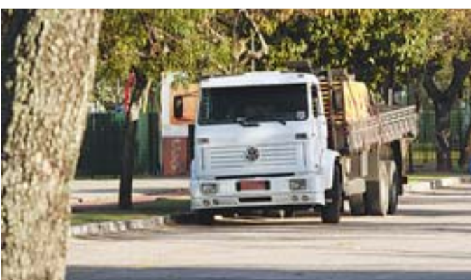
O CAMINHÃO de uma empresa ocupava três vagas de estacionamento na Praça da Ciência, na Praia do Canto.