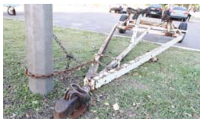
O REBOQUE DE UM BARCO estava preso a um poste com correntes e cadeado na Praça dos Desejos.