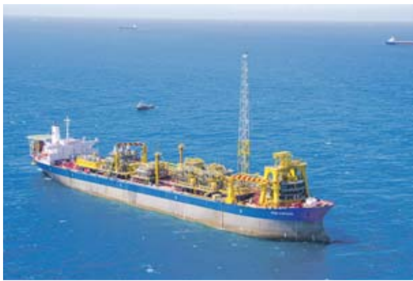
PLATAFORMA explorando óleo nas águas do Estado, onde PTTEP vai atuar