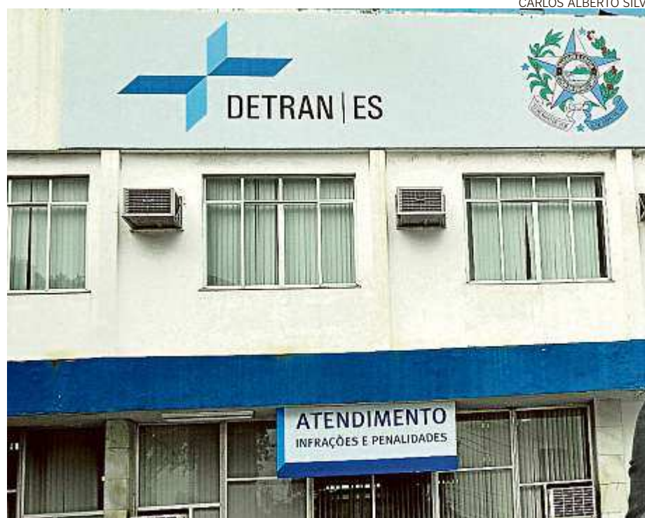
Detran é um dos órgãos com concurso autorizado para contratar 151 pessoas