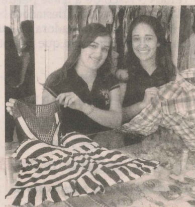
VENDEDORAS destacam preços