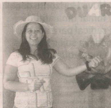
LUCILENA: pescaria de brindes

O local vende produtos de papelaria, brinquedos e várias opções de presentes. “Ainda este ano queremos implantar cursos de artesanato aqui.”