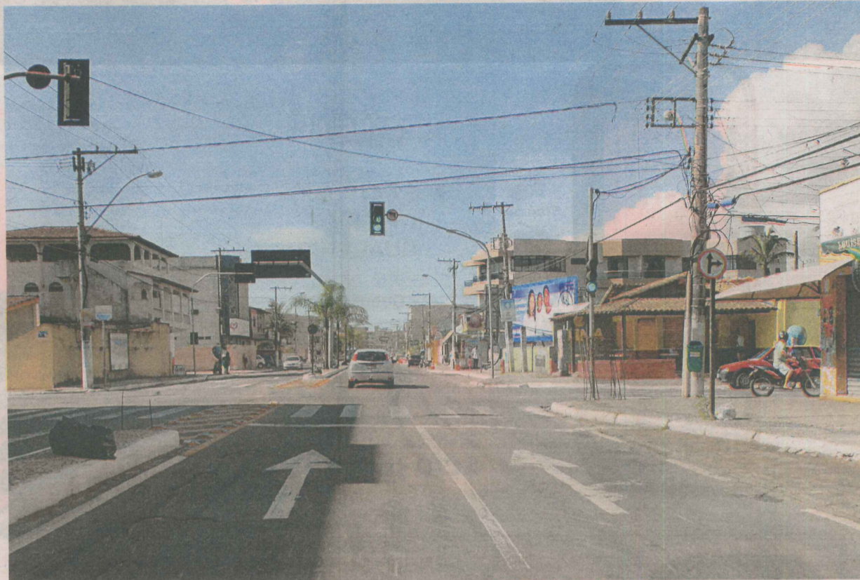
CRUZAMENTO da avenida Abdo Saad com a rua Minas Gerais: obras da rodovia vão desafogar trânsito na região

A Rodovia do Sol Norte faz parte de uma das 51 ações do Programa de Mobilidade Metropolitana (PMM) do governo do Estado.