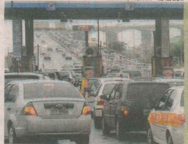
ADRIANO HORTA - 12/12/2011

ENTRE as propostas apresentadas pelos candidatos de Vila Velha estão ações para melhorar o fluxo do trânsito na Terceira Ponte.