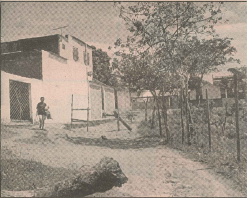
Não faltam árvores nas ruas de Porto Canoa