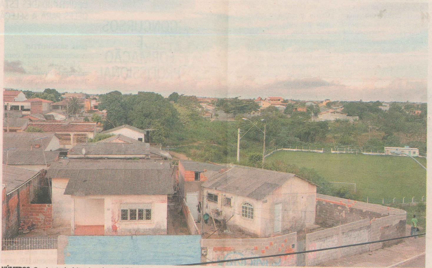
NÚMEROS. Conjunto habitacional tem 850 casas construídas e número estimado de três mil moradores.