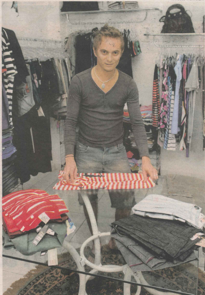
CEMAR ensina a transformar roupas básicas em peças diferentes