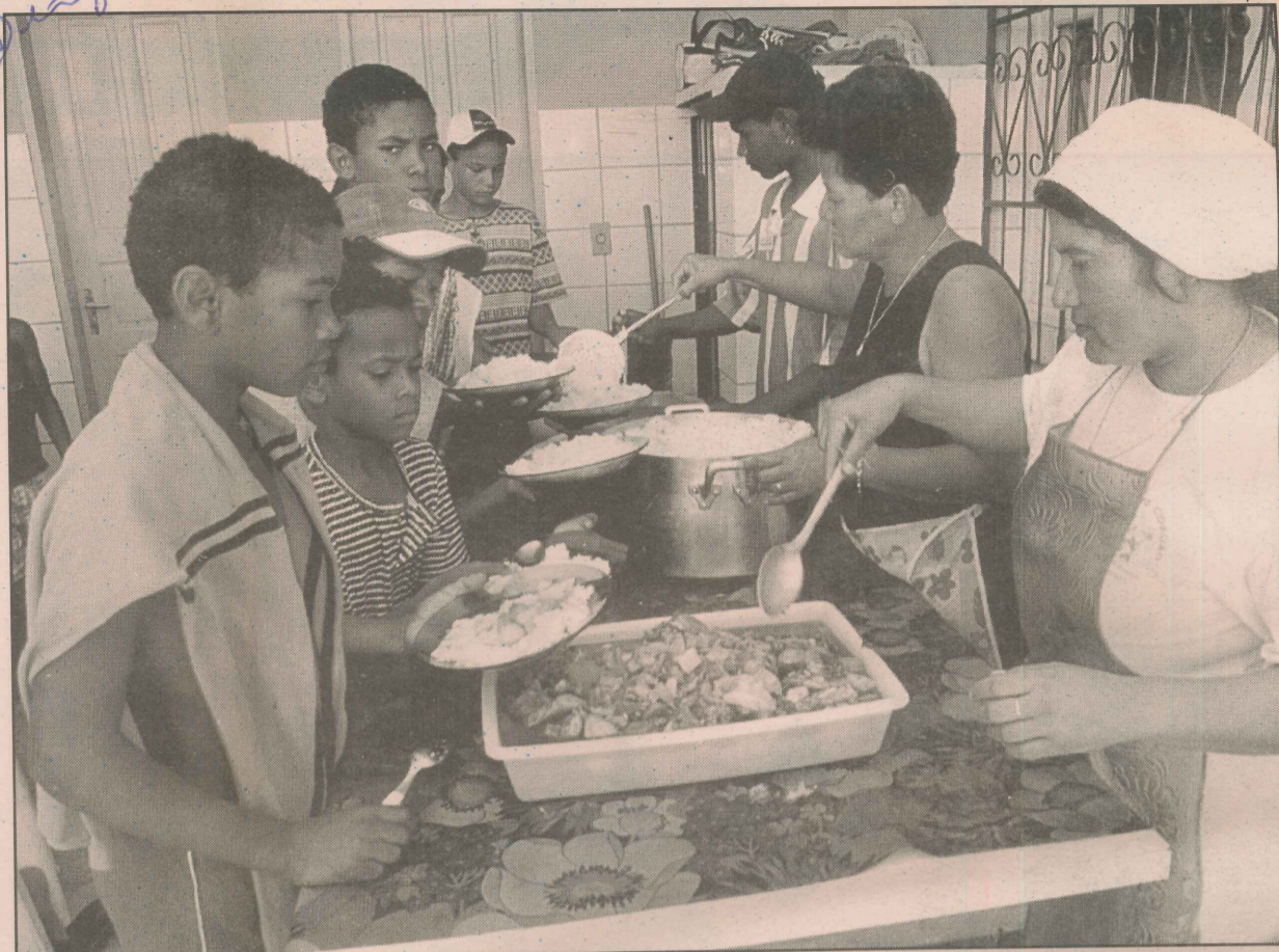
Cento e sessenta crianças a partir de 8 anos participam do Projeto Cidadão