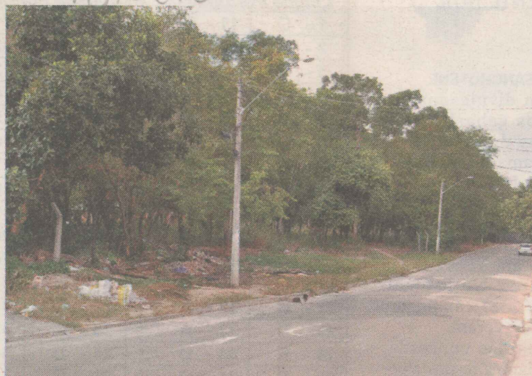
PROBLEMAS. O terreno foi doado à prefeitura por uma empresa particular.

A comunidade também pede mais atenção da prefeitura em relação ao campo de futebol, que atende a crianças carentes das comunidades. O adminis-